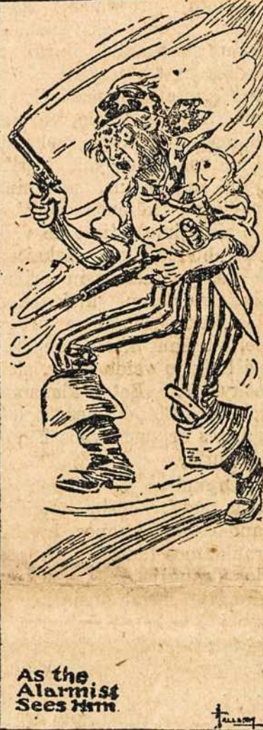
As the Alarmist Sees Him