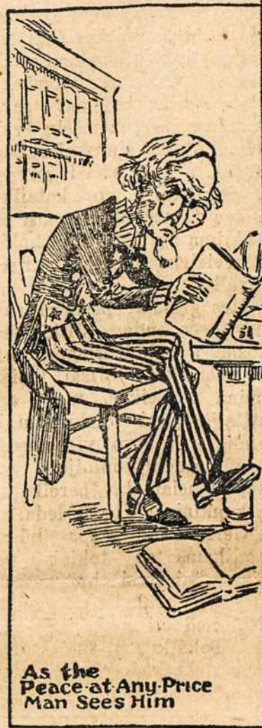
As the Peace at Any Price Man Sees Him