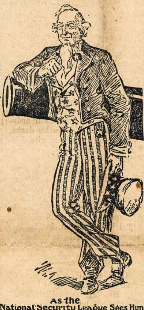
As the National Security League Sees Him