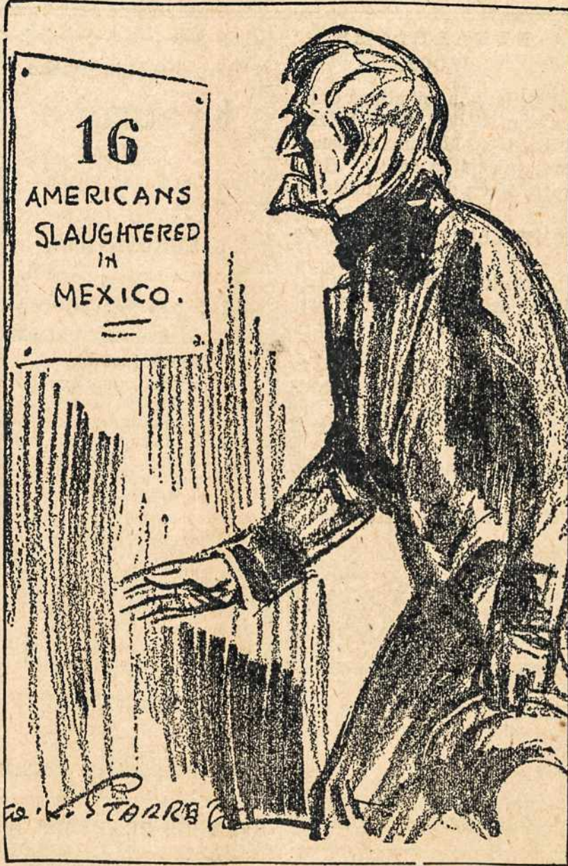
—Starrett in New York Tribune. AMERIKO SDIPLOMATINIAI LAIMEJIMAI MEKSIKE.

Buskus B. J. 866 Bank St. Kovas Juozas, 21 Congress Ave. WATERBURY, CONN.