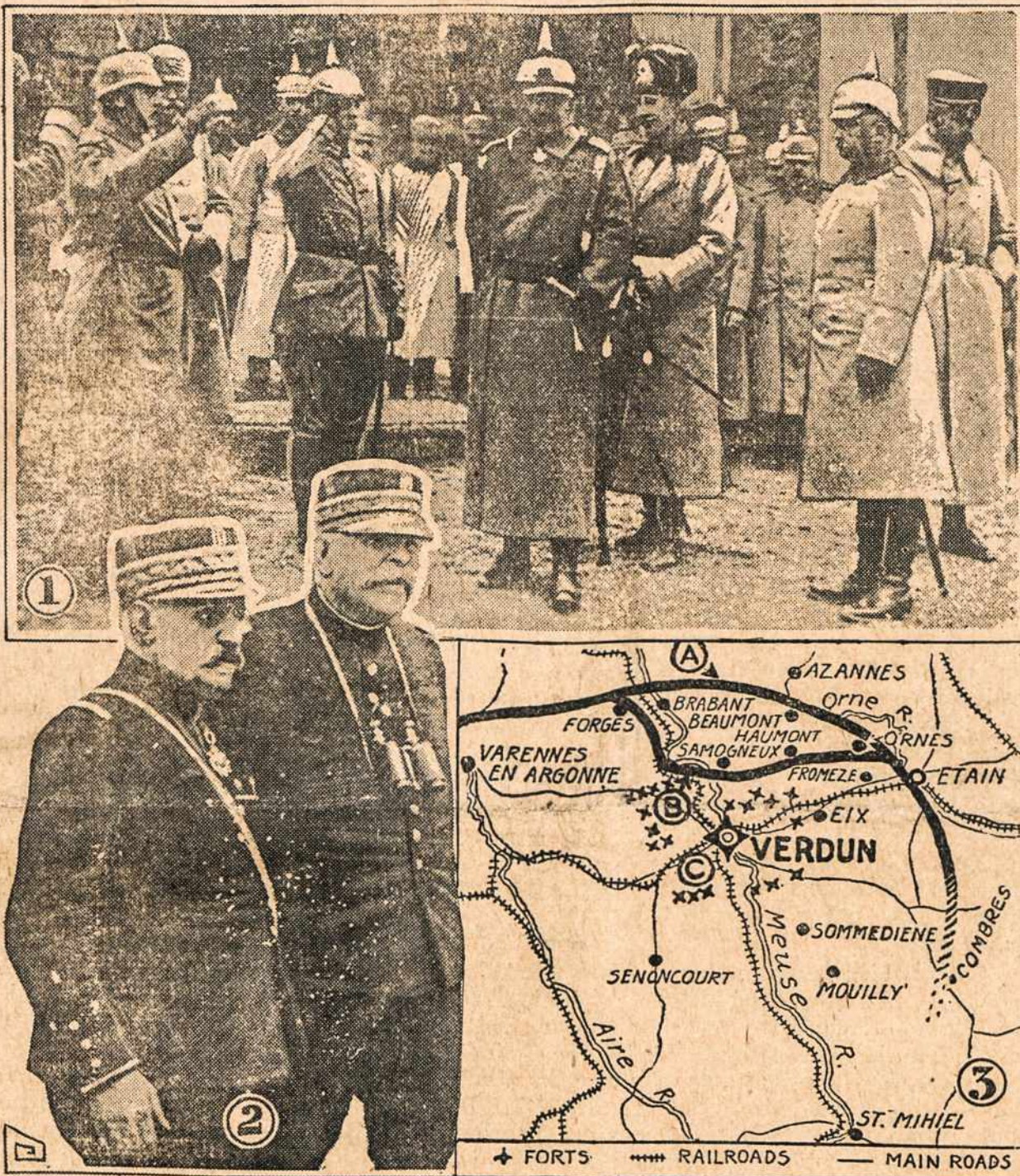
(1) Parodoma kaizerio įpėdinis (viduryje) ir jo stalas. Jis vadovauja vokiečiams prie Verduno. (2) Gen. Joffre (didesnysis) vyriausysis francūzų vadas ir gen. Castelnau, komendantas Verduno tvirtovės. Žemlapis parodo Verduną ir jo apygardą, kur eina baisiausi mušiai.

Kaip truputį anksčiau didį kraujo praliejimą buvo sutrukdžius baisi viesula su lietim, kuomet žemė buvo pabliurus, tai dabar tam baisiam mušui einant apsiėmė kitas gamtos prajovas. Užėjo dideli šalčiai ir labai daug prisnigo. Eina dideli pustymai ir labai trukdo karinį veikimą. Bet