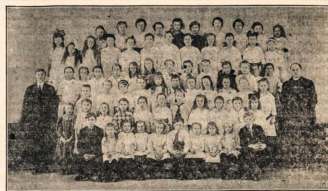
Mažųjų choras Montello, Mass. prie šv. Roko parapijos. Yra puikiai išlavytas varg. p. V. Juškos.

Po tam pasirodė ant estrados vietinis vargoninkas (svetintautis, nes lietuvio neturime) su savo drangu pianistu (ir svetintautis), vargoninkas padainavo angliškai solo o jojo draugas paskambino ant pirono. Nors tai dailiai dainavo ir skambino, ale vis nelietuviškai! Toliaus pasirodė lietuvaivė viena — pirmą o kita