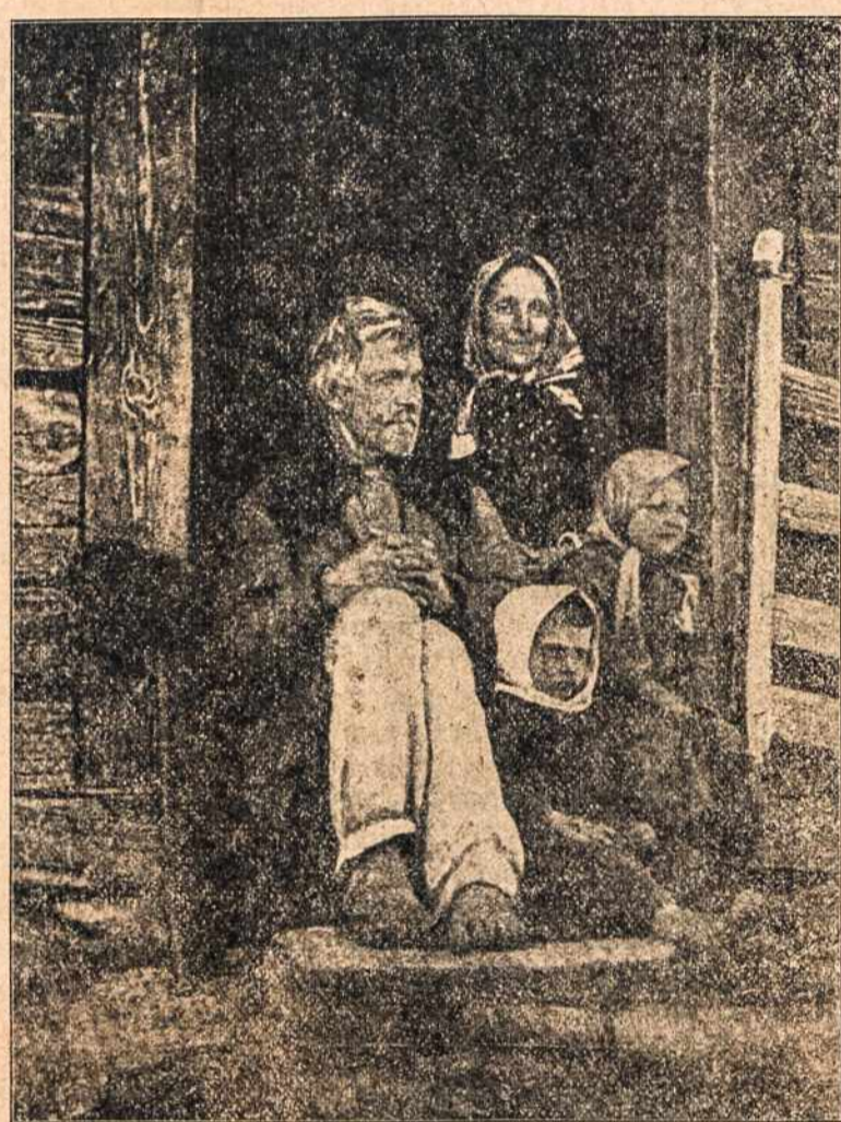
Čia parodoma viena iš daugelio lietuvių šeimyna, tapusi baidios karės auka. Nesigalėkė ir aukų sušelpimui panašių tautiečių, kurių yra dešimčiai tūkstančių.

Rymas. — Vokietijos valdžia pasisekė pakreipti Rumunijos valdžią į savo pusę ir Rumunija sutiko parduoti javus teutonams. Rumunijosgi gyventojai nekencia teutonų ir trijuose miestuose sukėlė didžias riaušes, bandydami tuomi parodyti priešingumą teutonams ir sustabdyti javų gabėmą į Austriją ir Vokietiją. Kariuomenė saugoja vokiečių konsulatus. Per visą laiką nuo karės pradžios rumunai rodo didį neprielankumą teutonams. Rumunijos valdžia vis svyravo.