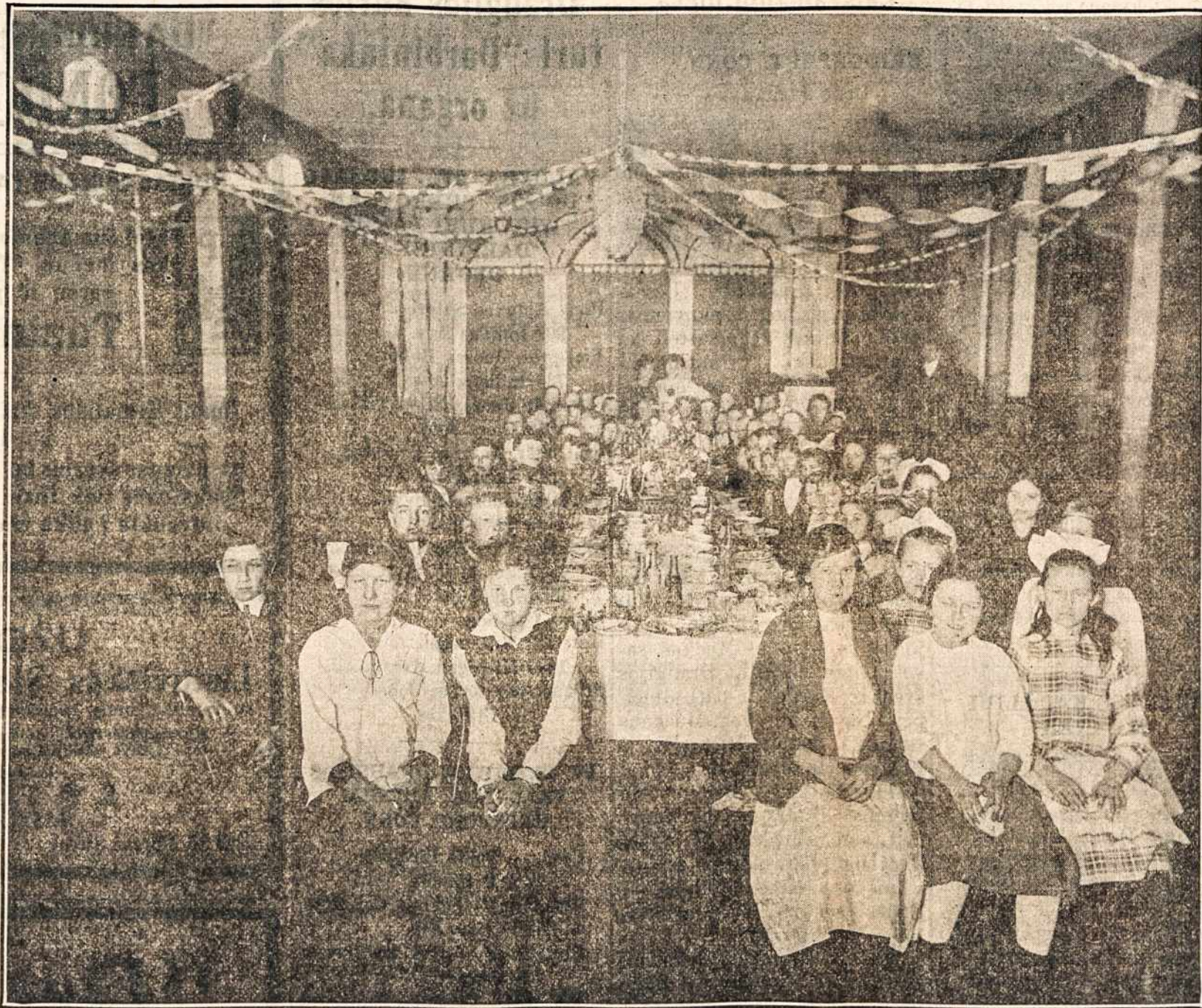
NEW BRITAIN'O, CONN. JAUNUOMENĖS VAKARIENĖ.

Taip tai išrodė Bridgeporto bažnyčioj, bet pažūrėkime į velnio koplyčias. Ten buvo