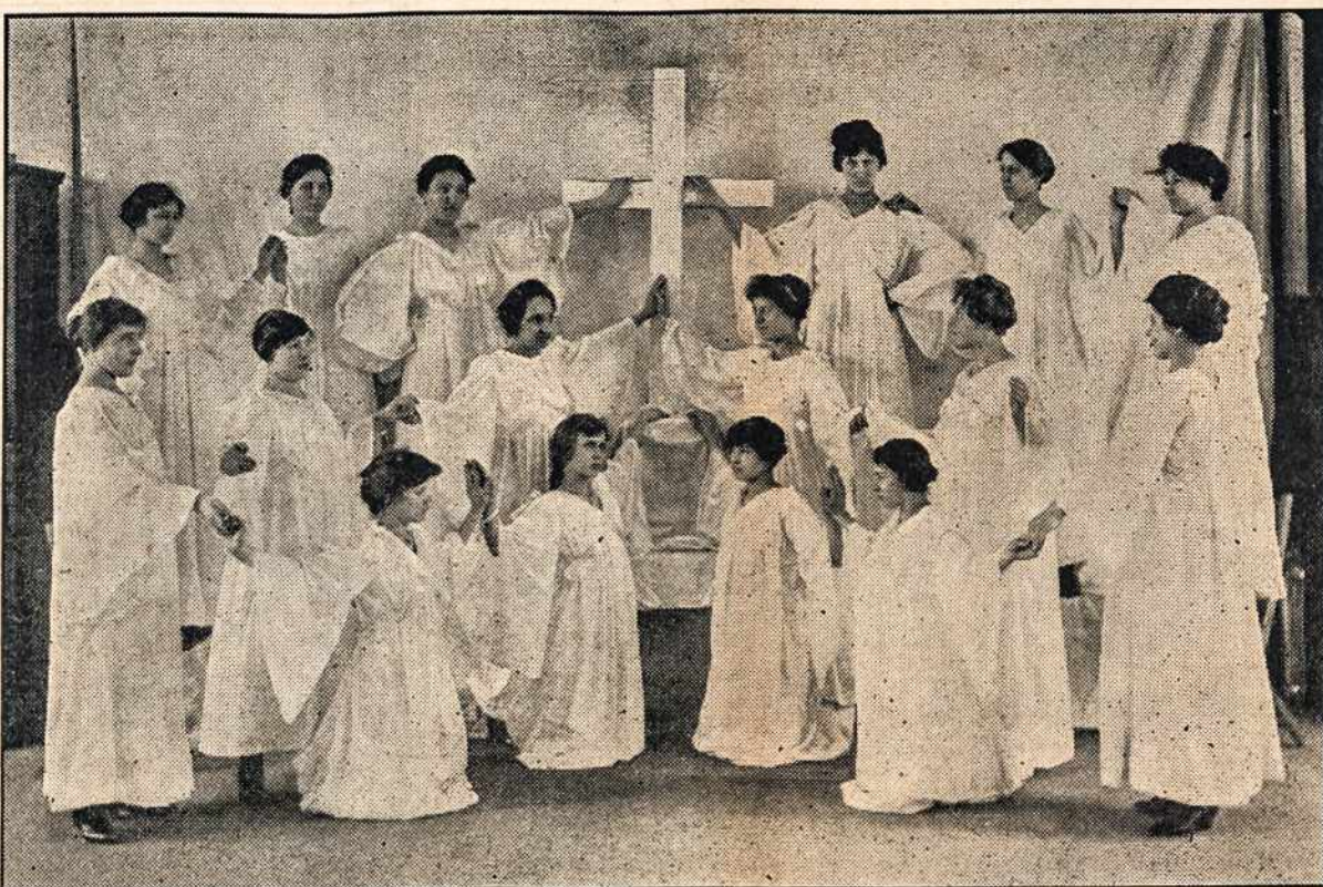
Montello, Mass. lietuvių giesmininkės, kurios bal. 29 d. šauniai išpildė "drilių."

Amžių uola, prie tavęs Pulsiu, neatmesk manęs. Tegų kraujas ir vanduo Iš šio švento šono tuoj Nuplaus nuodėmių purvus Ir išgydys mūs vargus. Savo jėgomis negaliu Pergalėt neprietelių