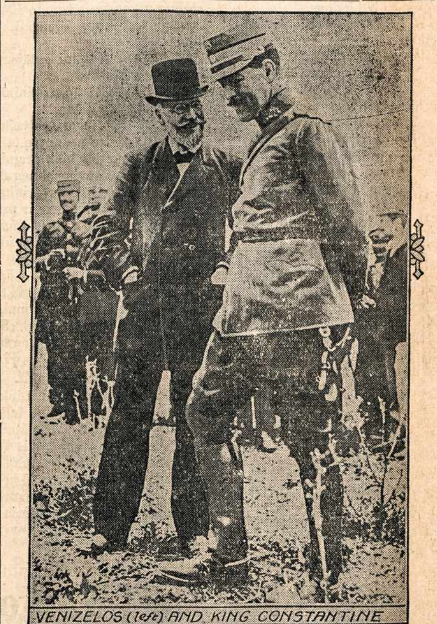
Čia parodoma Graikijos karalius Konstantinas ir buvusis premieras Venizelos. Dabar Venizelos pateko atstovu parlamentam.

Vokiečių valdžia skelbia, jog per balandį nuskandinta 96 priešininkų prekiniai garlaiviai.