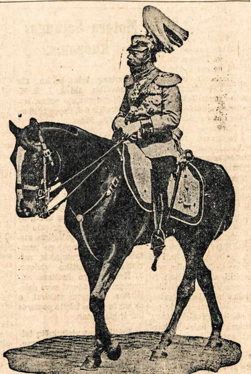
Anglijos karalius, kurs dabar sugrįžo Londonan. Iš-tisą savaitę perleido apžiūrindamas laivyną, sugrįžusi po didžiojo mūšio Danijos pakrastyje.