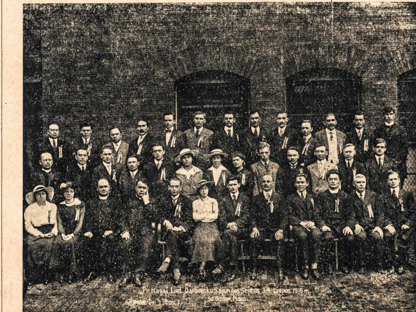
Pirmojo Lietuvių Darbininkų Sąjungos Seimo delegatai, kurie iš įvairių kolonijų suvažiavę liepos 3-4 dd. į South Bostoną padarė svarbius ir naudingus nutarimus darbininkams ir lietuvių tautai.

Lietuvių studentų Dr.-jai Jurievė 800 rub.