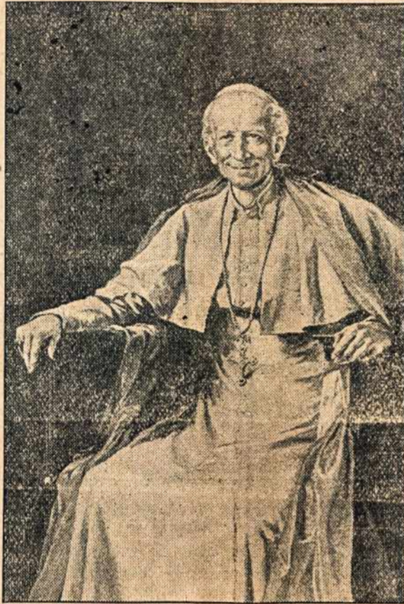
LEONAS XIII, pagarsėjęs savo enciklika apie darbininkų klausimą.