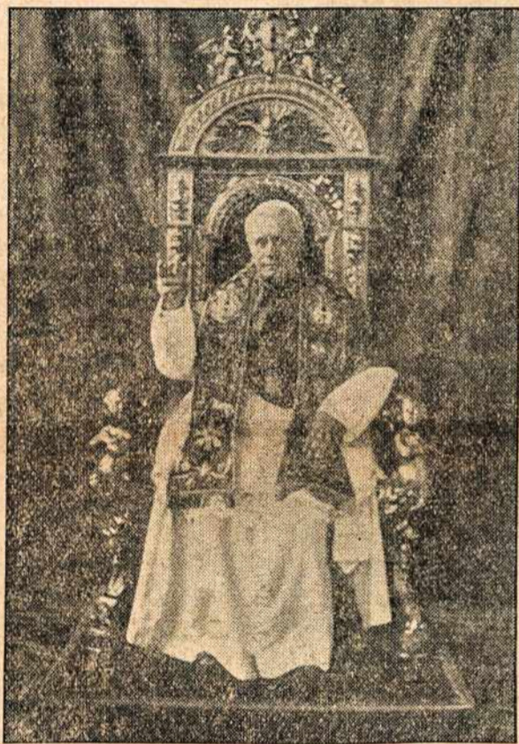
POPIEŽIUS PIUS X, didis ragintojas skaityti, remti ir skleisti katali- kišką spaudą.