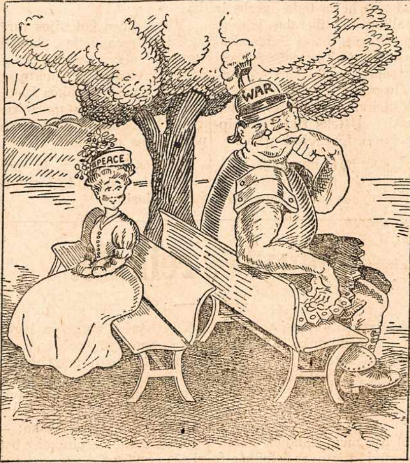
—Hodge in Spokane Spokesman-Review.

Dang' čia galės nuveikti ne- utralių šalių balsai, ypač A- merikos. Jeigu Amerika spusti- tų kiek Anglija duotų sup- rasti, kad nebeduos maisto ir a- municijos, tuo pat palenkty an- glus prieš taikos derybų. Deja, jeigu žinios iš Washingtono y- ra tikros, Suv. Valstijų vald- žia, matyt, nesiskubina ta- me dalyke veikti, ypač veikti energiškai. Ji žadanti pirma