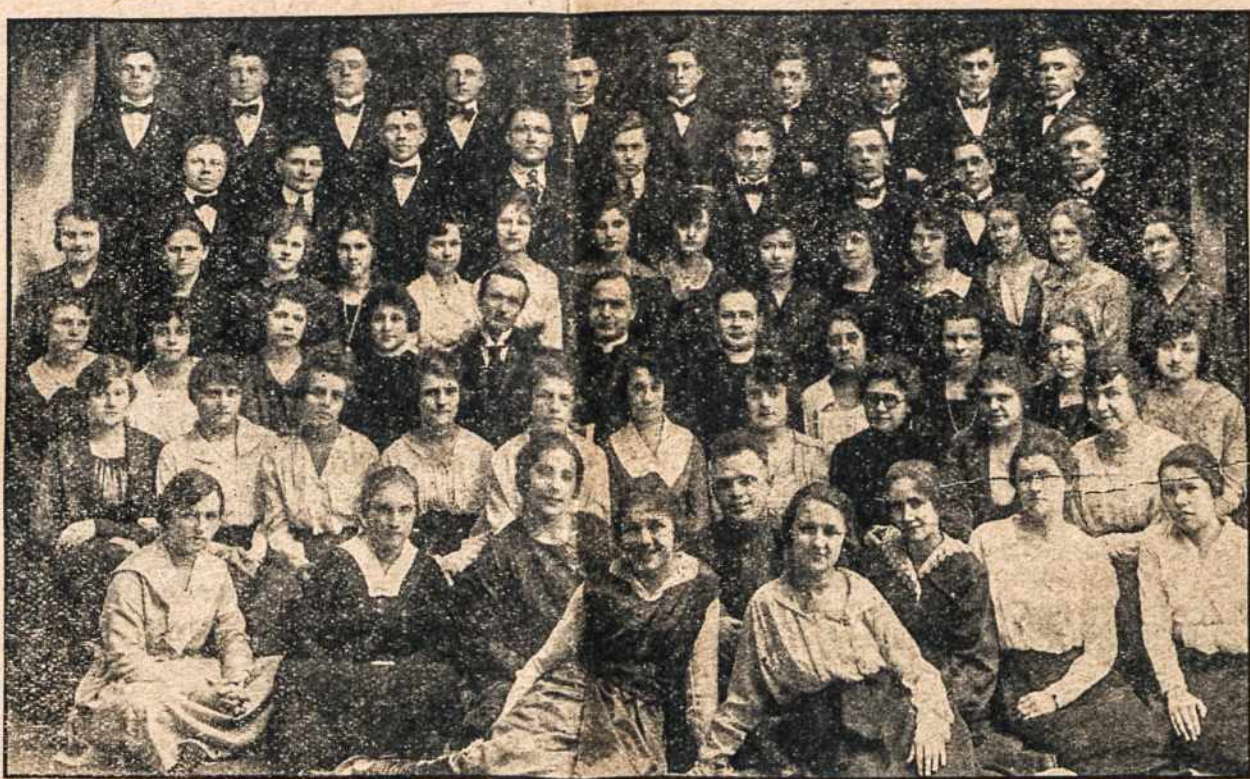
šv. Kazimiro parapijos choras, Worcester, Mass.

Vienas Norvegijos, antras Švedijos laivas nuskendo, užėję ant klaidžiojančios mimos. Žuvo 25 žmonės.