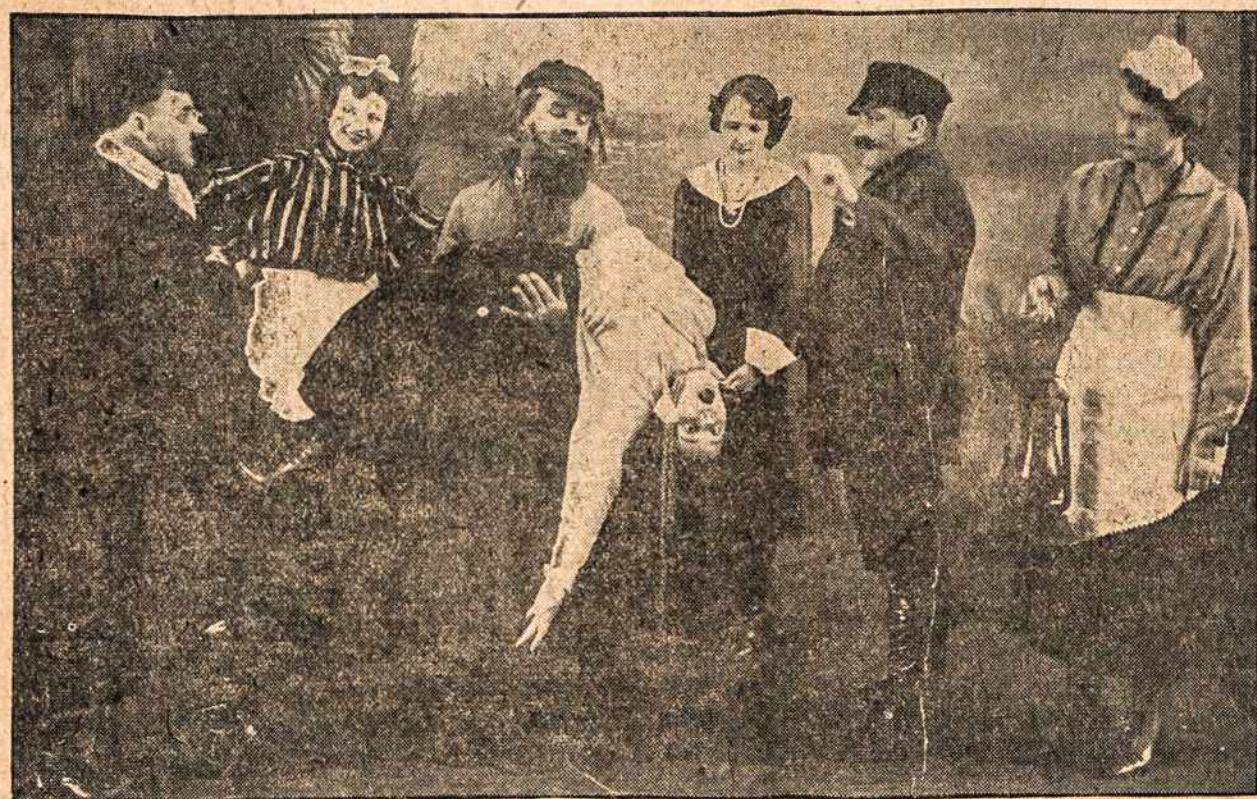
Iš meilės turin mirti.

Ant šokių įžanga tik 35c. ypatai. Įžanga 35, 50 ir 75 c. ypatai.