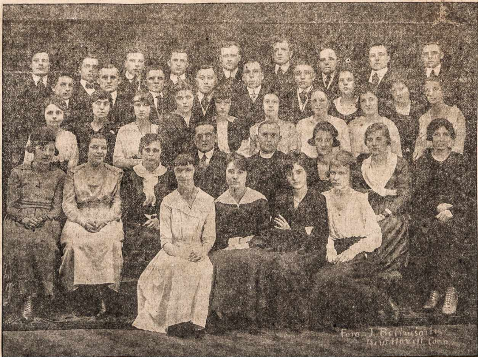
šv. Kazimiero parapijos choras.