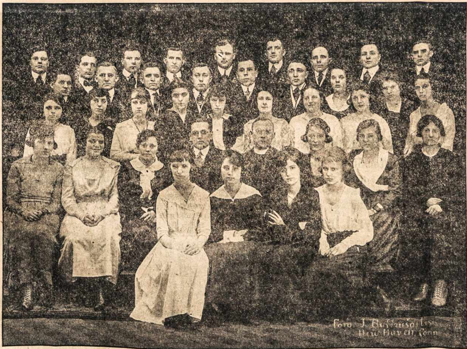
šv. Kazimiero parapijos choras.