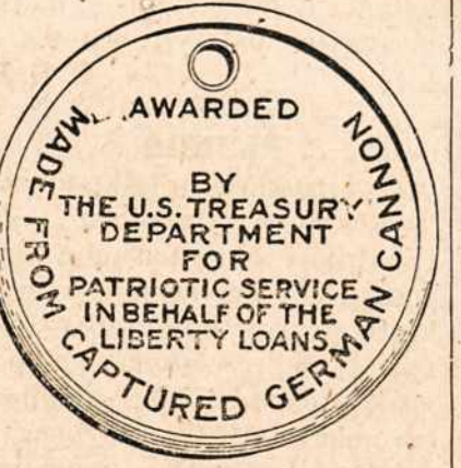
Viena medalio pusė.

Dėdė Samas įveda naujany-bę. Už uolų pasidarbavimą civiliam darbe duos medalius. Dabar geriausia pasidarbavu-sieji Penktosios Paskolos rei-kalais, gaus čionai parodomą medalį. Čia parodoma abi medalio pusės. Tie medaliai yra nulieti iš armotos atintos nuos vokiečių.