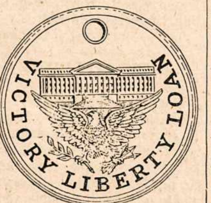
Antra medalio pusė.

Iš New Yorko išplaukė ašt-unas garlaivis su maistu ir drabužiais del žmonių Mažojojo Azijoje.