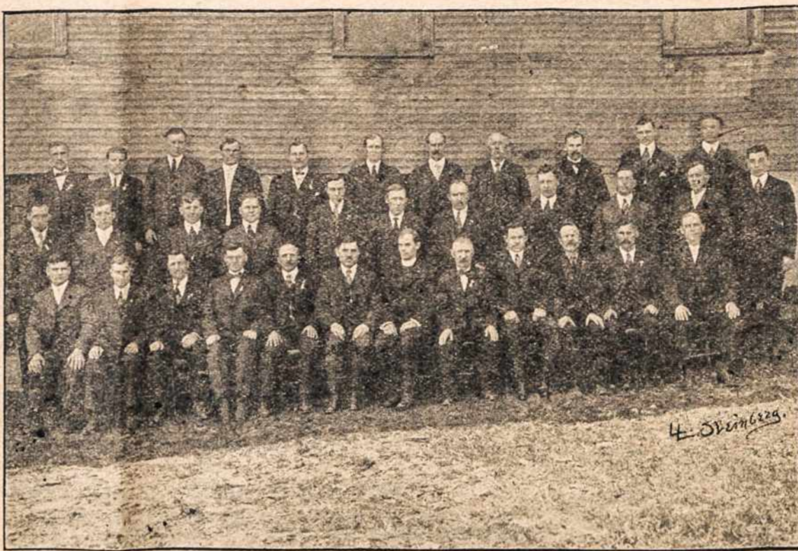
LDS. 55 kp. DuBois, Pa.