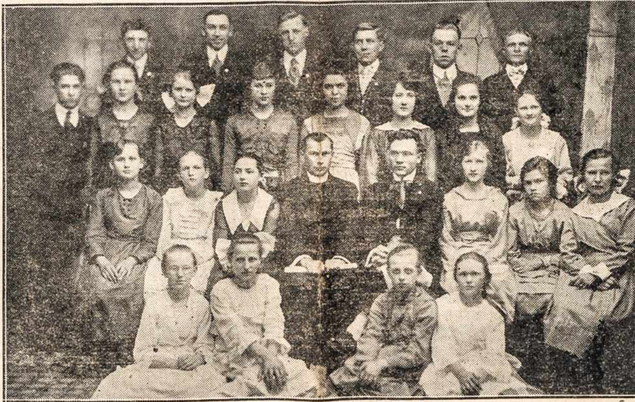
Šv. Vincento parapijos choras, Girardville, Pa. pasidarbavęs del Lietuvos ir remėjas gerų ir naudingų sumanymų.

Vakarinię Vengriją apie miestą Oedenburg sodiečiai buvo sukilę prieš raudonąją valdžią. Iš pradžių raudonoji Vengrijos valdžia atsinejo savo agentus ir jie prikalbinėjo sodiečius priimti bolševizmą. Sodiečiai apreiškė nenorį bolševizmo ir norį prisijungti prie Austrijos. Raudonoji valdžia buvo paskelbus rekviziciją maisto ir drabužių. Sodiečiai tuomet sudarė armiją iš keletos tūkstančių, apsiginklavo dalgaliais, kirviais, šakėmis, o kairurie šautuvais ir nutarė gintis. Tai po to prieš juos buvo atsistą raudonoji armija su armotomis ir kulkosvaidžiais. Ištiko baisi skerdynė. Sodiečių armija buvo tuoj išblaškyta. Sodiečiai sodžiuose gynėsi ir jų buvo išskerta virš 3.000. Žuvo vyrų, moterų ir vaikų.