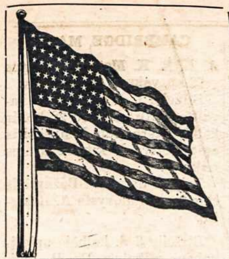
Entered as second-class matter Sept. 22, 1915 at the post office at Boston, Mass., under the Act of March 3, 1879."