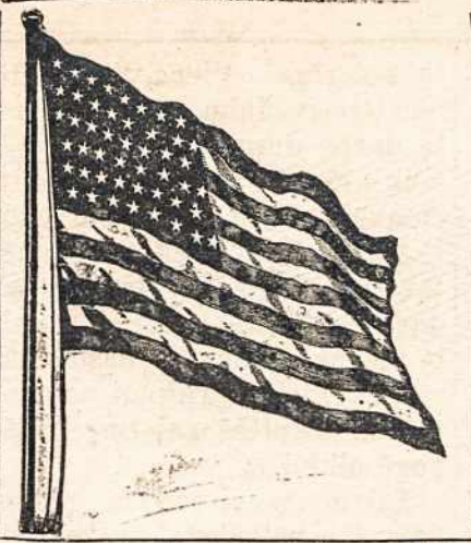
Entered as second-class matter Sept. 22, 1915 at the post office at Boston, Mass., under the Act of March 3, 1879.