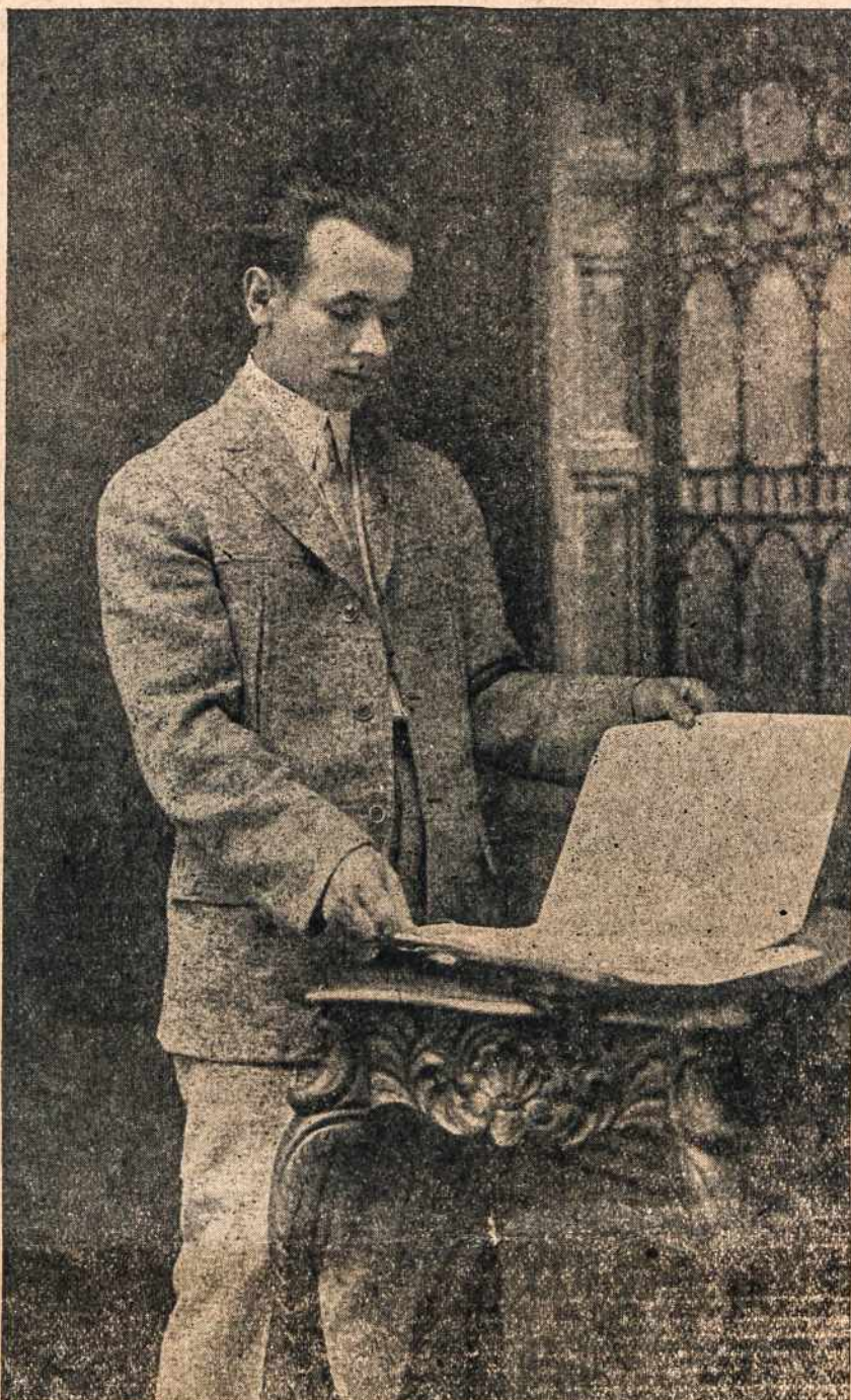
A. ALEKSIS, vienas žymiausių lietuvių kompozitorių, Detroito lietuvių vargonininkas, vyčių himno kompozitorius. Jis bus vyriausiu vadu muzikaliao programo.