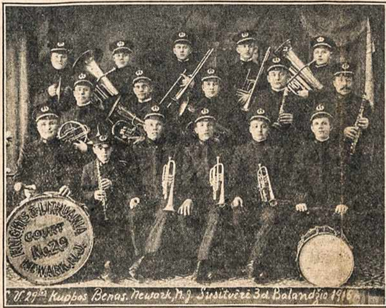
NEWARK'O, N. J. VYČIŲ BENAS.

Iš Genevos pranešama, kad paleistasis gandas buk Bruseelis renkamas Tautų Lygos sostine, vietoj Genevos, esąs neteisingas. Francijoje 10.000 Amerikos kareivių sergsti 40.000 Vokietijos nelaisvių. Jie negali būti sugražinti Vokietijon iki tol, kol tris alijantų valstybės pavirtys taikos sutartis. Tų nelaisvių užlaikymas Amerikai atseina $1.000.000 mėnesyje