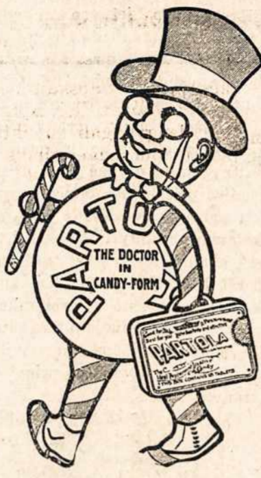
Partola saldainiai parduoda- mi didelėse dėžutėse už 1 dol. (38)