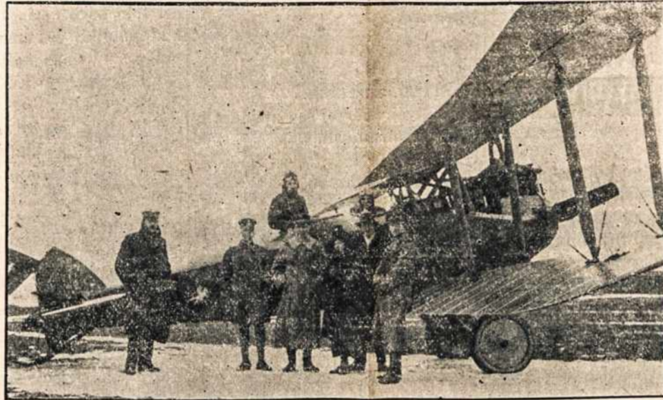
Lietuvos orlavis stovis ant vietos.