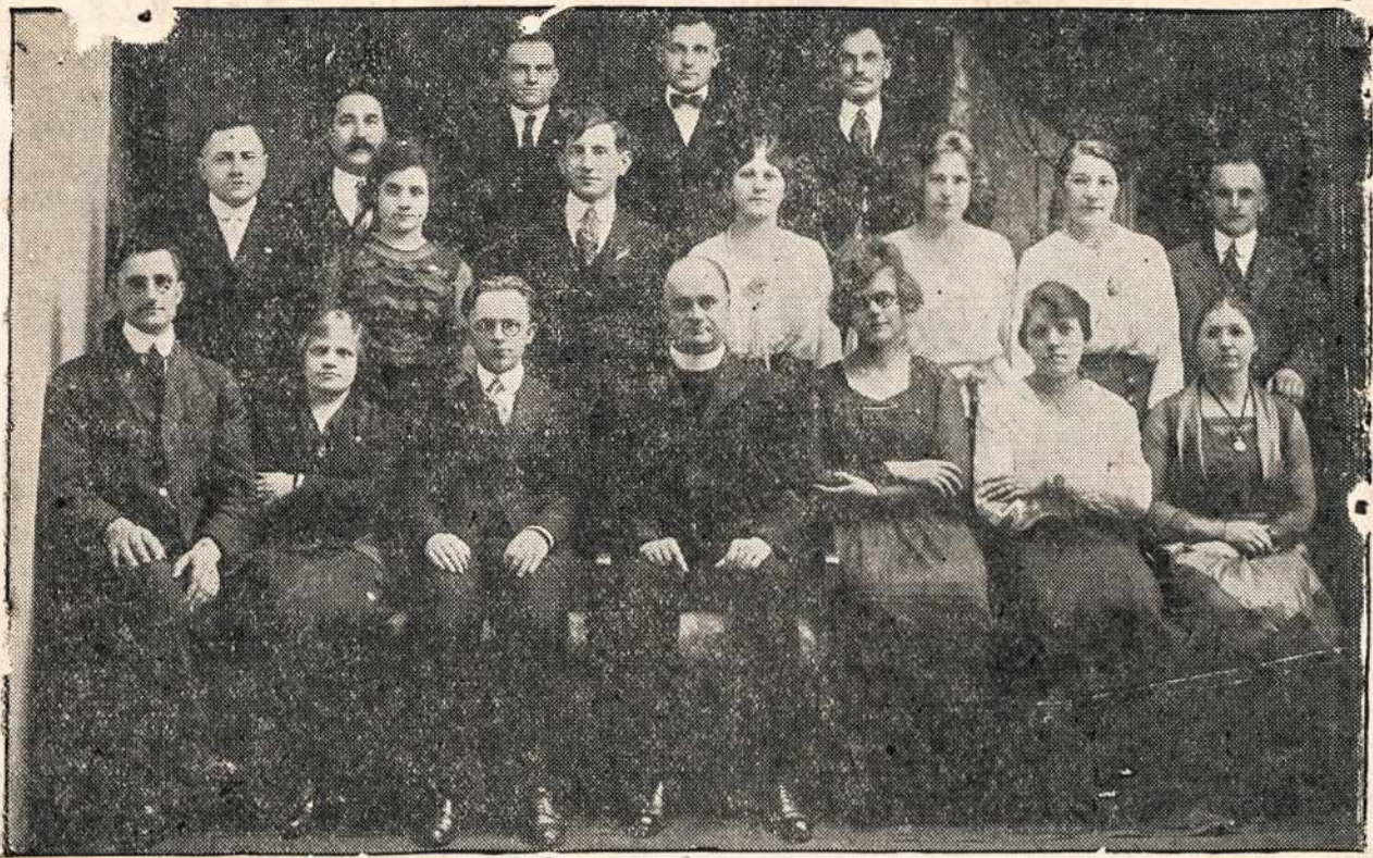
Jaunosios Anglijos lietuvų veikėjai, kurių pastangomis pereiną vasarą surengta du didžiausiu pikniku.