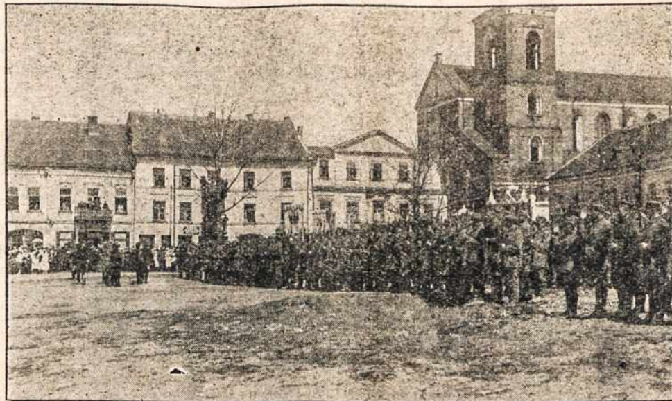
Lietuvos kariuomenė prie šv. Petro katedros Kaune.

Vokietijoj metalo darbininkai buvo paskelbė generalį streiką. Bet mažai kas atsiliepė.