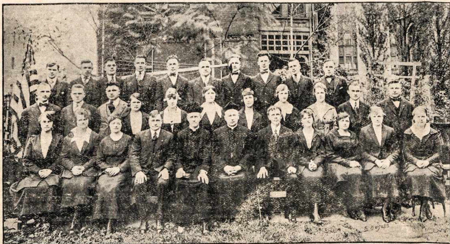
Sv. Cecilijos Choras.