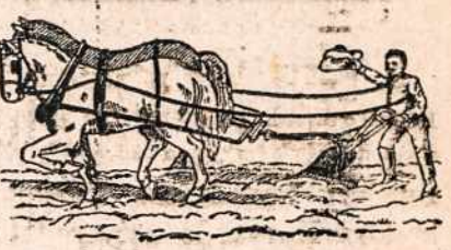
"DABAR VĖL SMAGU DIRBT"

Žinoti žmonių gavo paelbą vartodami mūsų Namini Metodą del reumatizmo per pericitus kelius metus. Jei kenčiat skausmą kojose, rankose, ar naruose, jei nariai yra skaudi ir sustyrė, ir jei kenčiat nesmagumus su kiekviena oro permaina, štai Jusy proga pamėgint naują, lengvą, pigią, metodą. Mes kviečiam Jusis rašyt. mums del pakeitimo, kurį suteiksiti dovani! Kiekvienam šio laikraščio skaitytojui.