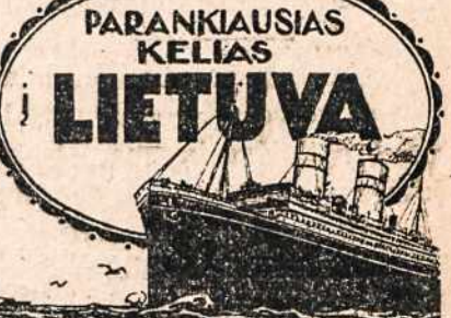
PARANKIAUSIAS KELIAS I LIETUVĄ

PLEASANT METHOD CO., 3624 N. Ashland Ave., Chicago, Ill. Delpt. X 10