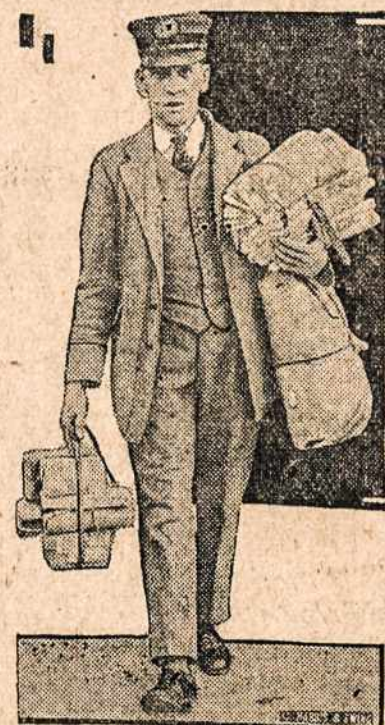
Laikų išnešiotojas, kuris šiemet turės Kalėdų dienų vakcijas. Todėl reikia Kalėdų dovanas siūsti ankščiau, negu kitais metais.