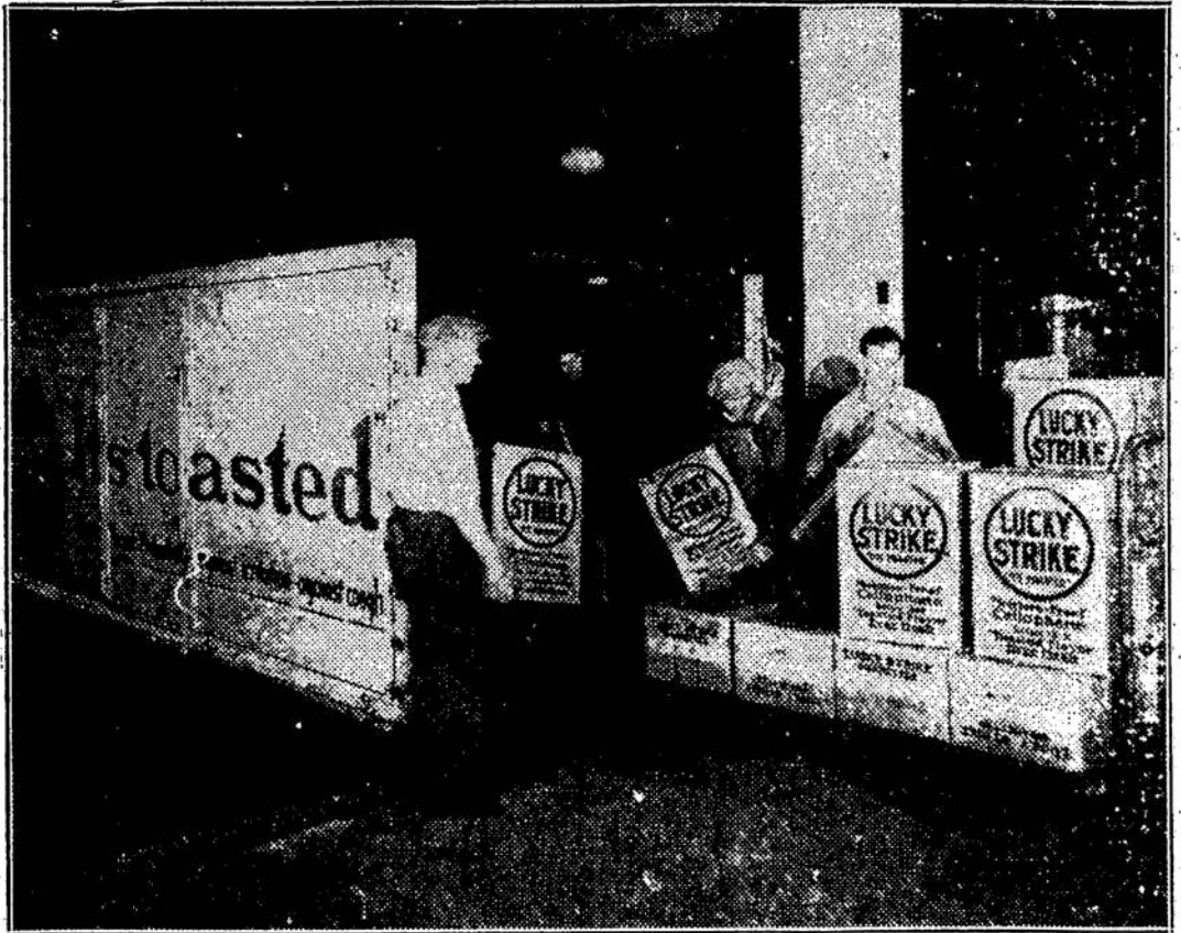
Atsidaro Didžiulė Nauja Krovinių Stotis New Yorke

Darbininkai teisėjui paai- škino, jog jiems buvo įsaky- ta suardyti blogiausiai atro- dantį automobilių, kurs bu- vo tame jarte.