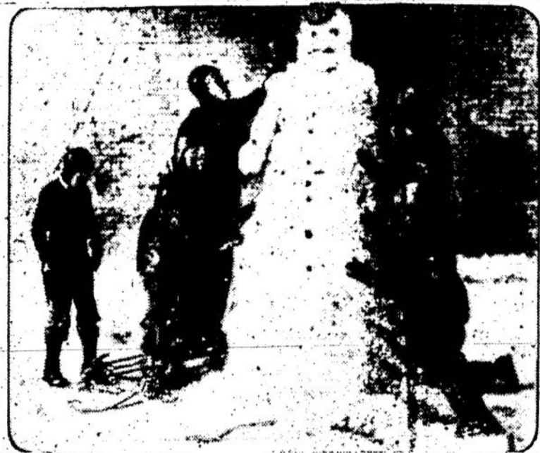
North Dakota valstijoje neseniai buvo labai prisniigta. Mokyklos buvo uždarytos. Sniegas buvo su dideliu pustumu; daugelis miestų per 60 valandų buvo netekę šviesos, šilumos, telefono bei telegrafo susisiekiimo. Tačiau mokiniams buvo tai džiugsmo dienos. Iš sniego jie lipdė sniegines stovyklas.

Žemės ūkio akademija paruošia Lietuvos diplomatus agronomus, miškininkus. Tai žmonės, kurie daugiausia turi reikalų su liaudimi. Malonu, kad būsimųjų agronomų ir miškininkų gražių skaičių sudaro ateitininkai.