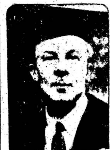
Anglijos Cambridge universiteto prof. Edgar Douglas Adrian, šiais metais laimėjęs pasaulinę Nobelio premiją už pasiūlymą medicinoje.