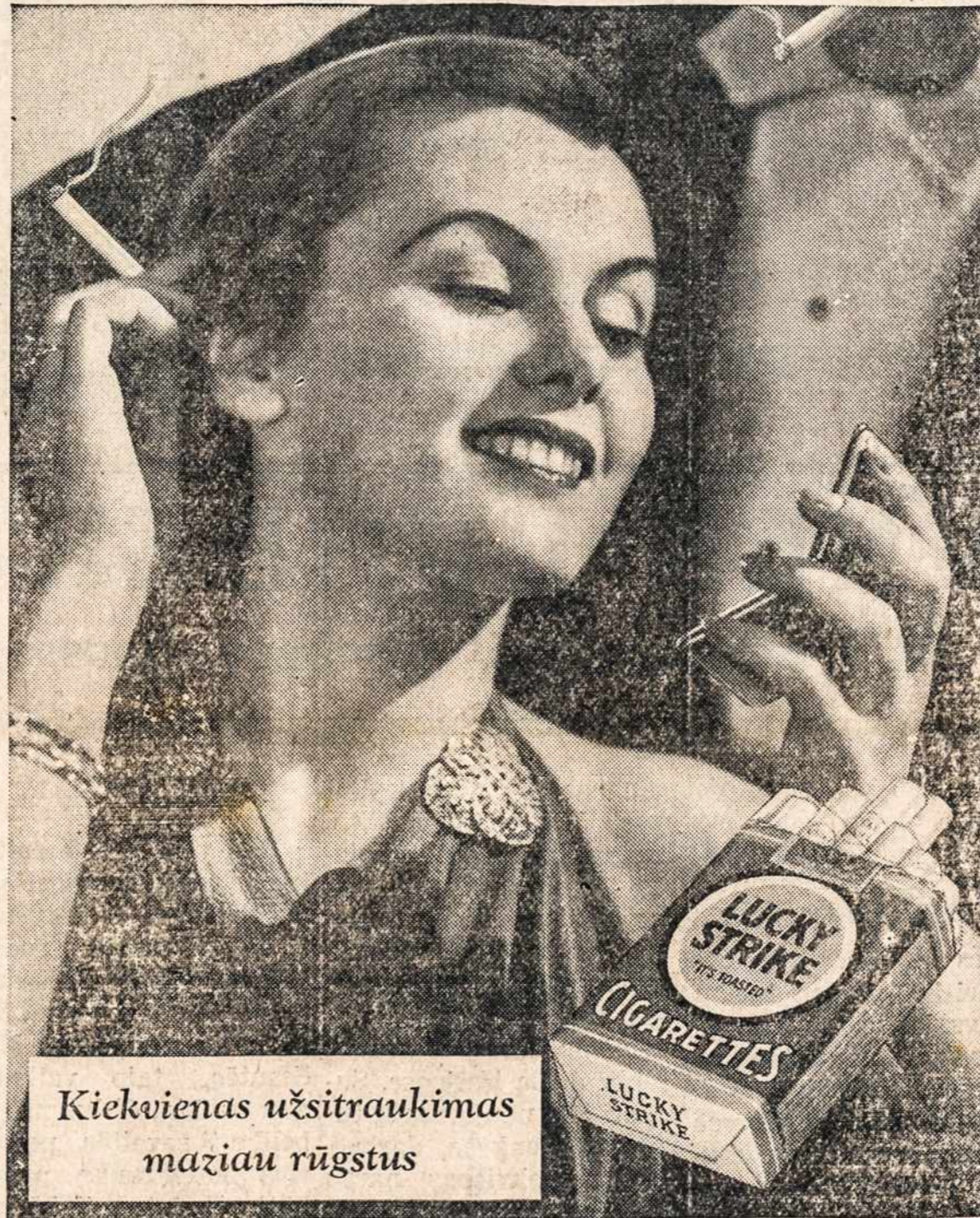
Kiekvienas užsitraukimas maziau rūgustus