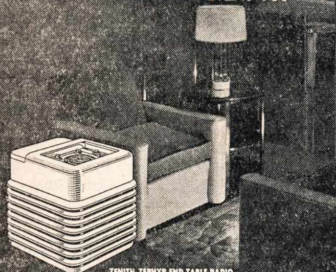
ZENITH ZEPHYR END TABLE RADIO MODEL 6-S-147

42 MODELS... available in four modern cabinet finishes (walnut... bone white... maple and ebanized)... priced from $29.95 to $75.00*