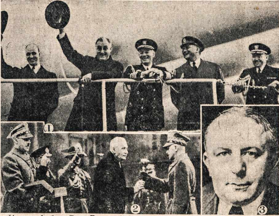
Čia parodo 1 — Prez. Roosevelt ir jo palydovus kelyje į Amerikos valstybių Taikos konferenciją, Buenos Aires, Argentina; 2— Lenkijos prez. Moscicki, kuris įteikia gen. Edwardui Rydz-Smigly maršalo lazda; 3— Roger Salengro, Prancūzijos kabineto narys, kuris neseniai nusizūdė, negalėdamas pakęsti pasmerkimų ir šmeižtų. Jis buvo socialistas.