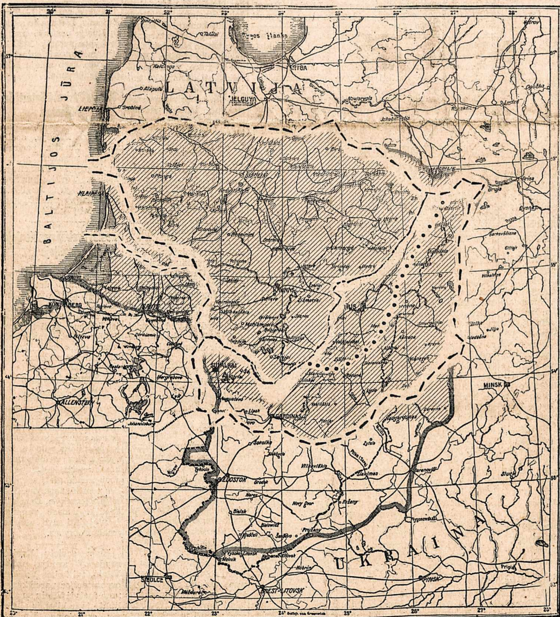
LIETUVOS teritorija: a) pažymėta stambiais ilgiais brūkšniais, reiškia rubežius, nustatytus Lietuvos ir Rusijos sutartimi 1920 m., liepos 12 d.; b) pažymėta silpnais brūkšniais, reiškia demarkacijos liniją, kuri išvesta, smurtu užgrobus lenkams trečdalį Lietuvos su sostine Vilniumi, 1920 m. spalio 9 d.; c) pažymėta stambiais trumpais brūkšniais trikampis prie jūros, reiškia teritoriją, kurią prievarta Vokietija atplėšė nuo Lietuvos 1939 m. kovo 23 d.; d) pažymėta stambiais taškais, reiškia sieną, kurią nustatė Lietuva ir Rusija šio mėnesio (spalio) 10 d. Šia sutartimi Lietuva atgavo sostinę Vilnių ir dalį savo teritorijos.