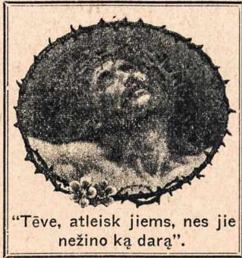
“Tėve, atleisk jiems, nes jie nežino ką darą”.

Kiekvieno įžymaus žmogaus mirties valandoje tarti paskutiniai žodžiai yra reikšmingiausi. Jėzus buvo žmogus ir Dievas. Todėl Jo žodžiai daug reikšmingesni. Juose tartum talpinasi visas Jo mokslas. Ką Jis žodžiais mokino, tą mirdamas - kentėdamas patvirtino.