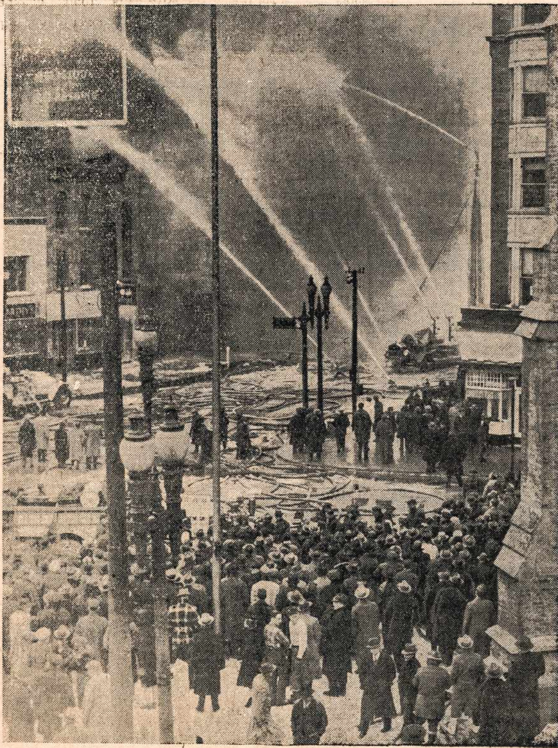
Milžiniškas gaisras, Syracuse, N. Y., biznio distrikte, kuris dege per 13 valandų ir palietė 16 kompanijų. Šimtas žmonių buvo laimingai išvesti iš degančių namų. Gaisro gesinimas buvo labai sunkus, nes šalčiui esant vanduo virsdavo ledu ir kova su ugnimi buvo labai varginanti ugniagesius.