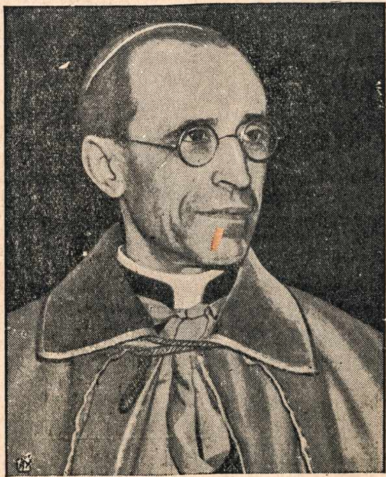
Jo Šventenybė Popiežius Pijus XII

1937 m. Amerikos orlaivių pramonė buvo verta tik $125,000,000 ir turėjo tik 36,000 darbininkų. Dabar toje pramonėje jau dirba 200,000 darbininkų, o kol šie metai baigsis, tai ten dirbs dvigubai daugiau darbininkų, negu dabar.