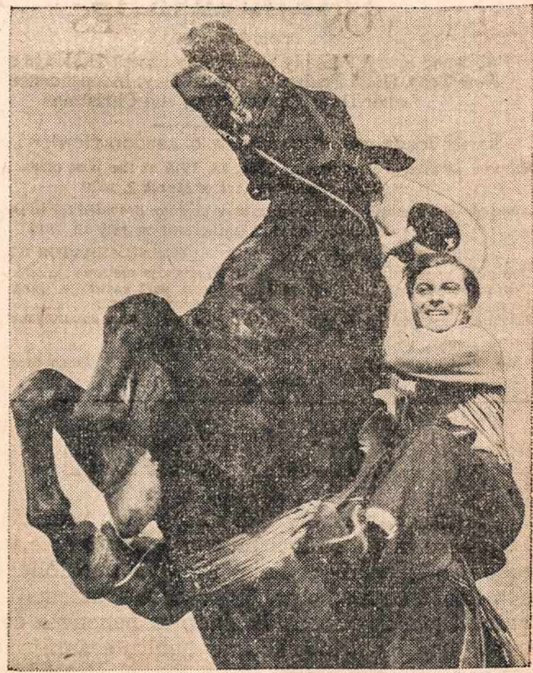
Tikras "cowboy", filminio pasaulio žvaigždė — George Montgomey, kuriam arklys pašokdyti ant dviejų kųjų tik vienas juokas.