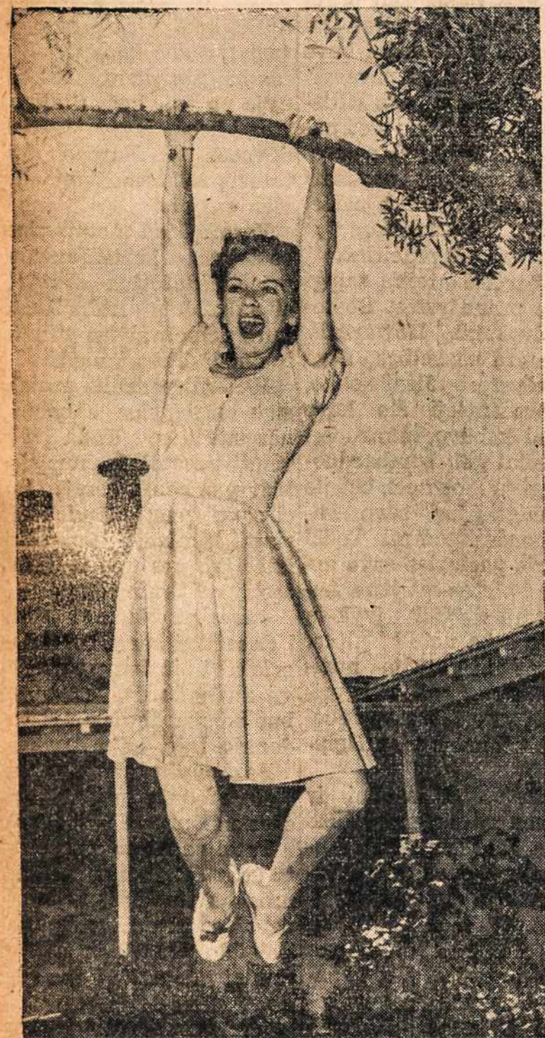
Filminio pasaulio žvaigždė pasikabinus ant medžio šakos supasi ir turi iš to malonumą.