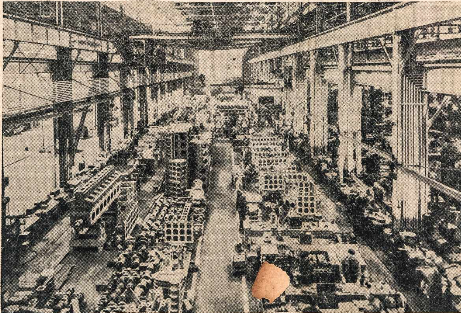
PAJĖGA LAIVYNUI. Sąryšyje su didinimu laivyno, einant savisaugos projekto patvarkymais, visoje šalyje paleista dirbtuvės 24-rių valandų darbo eigai. Vaizde matome vieną iš General Motors, Cleveland dirbtuvės grindų salę, kurioj randasi įvairūs motoriniai dalykai.

Yra sakoma, būk Vokietijos kariniai strategai iš visų išgalių vengia turėti du karo frontus. Sakoma, būk vokiečiai darę Maskvai didžiausias nuolaidas, kad tik išvengus dviejų frontų. Dabar kaikurie nurodo, kad tas, ko vokiečiai labiausia bijojo, ima rodytis. Girdi, Balkanuose atsidaręs tas naujas frontas. Po teisybei tai ne visai taip yra. Balkanuose, tiesa, atsidarė karo frontas, bet užtat vakarinis frontas yra baigtas.