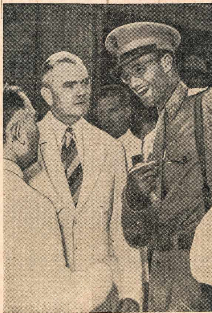
Kapitonas JIMMY Maniloje. Kelyje į Kiniją Prezidento sūnus kapitonas James Roosevelt, sustojo Maniloje ir šnekučiuojasi su Jung. Valstybių kariais.

Imkite sau, jog šis patarimas ir būtų išmintingu, ir žodžiai teisingi, kiek yra tokių, kurie galėtų jį įgyvendinti — kiek tokių, kuriems įsitikinimas, jog po šio gyvenimo nėra laimės, galėtų padidinti laimės šiame gyvenime? Žmonės daug kuo skiriasi viens nuo kito: kilme, sudėjimu, turtais, gabumais ir kitais dalykais. Rožės, vynas ir lėbavimas, net ir "geriausiam žemiškame pasaulyje" nėra visiems skirta. Didžiausia žmonių dalis turi sau kasdieninę duoną savo praktiku užsidirbti ir liūdėsysis ir vargai yra