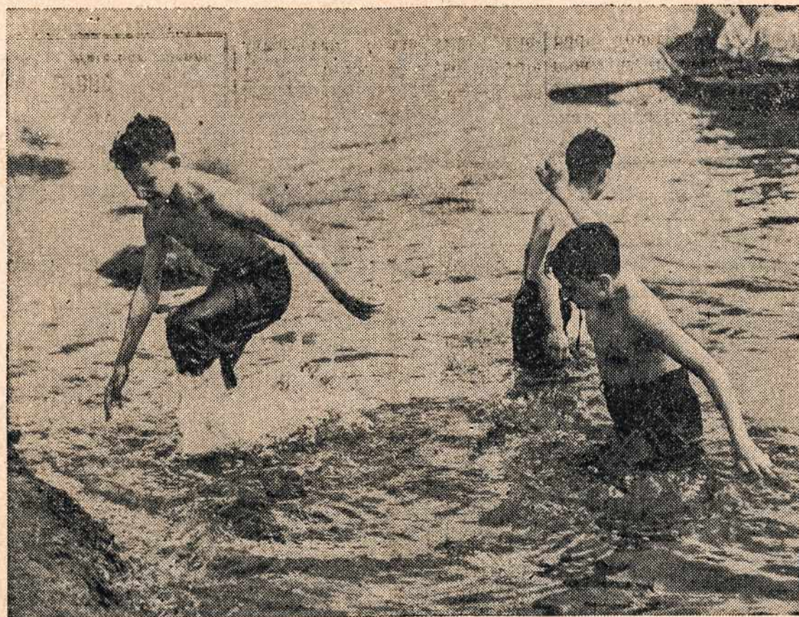
Keletas dienų netikėtoms pavasario šilumos pakvietė daugumą į vandens pakrantes. Štai ir šiame vaizde Didžiojo New Yorko jaunuoliai, naudodamiesi ta proga, nuvykę į Central Park Lake, sulindo į vandenį, bet Policija atvykus juos iš ten greit išprašė, nes tokį staigų atšilimą, gali pasekti ir staigus atkritimas. O tas sveikatą ir gyvybę kerta, kaip dalgis žolę.

Brangus Lietuvi! Esi kviečiamas, vardan Tautos ir Bažnyčios reikalu, kad atsimintum vienintę ir svarbią pareigą — paremti lietuvių ir katalikybės reikalus! Lai bus leista, Tamstai, priminti, kad šios įstaigos, kurioms yra skiriama šios dienos parama, yra būtiniausias mūsų išieivijoje, yra tai tvirtovės mūsų lietuvių katalikų išieivijoje. Iš jų šiandien plaukia viltis dėl šviesesnio rytojaus mums čia lietuviams išieiviams ir tuo pačiu mūsų tėvynei Lietuvai. Taigi padarykime intenciją šiandien, kad Liepos 4, vyksime Marianapo-