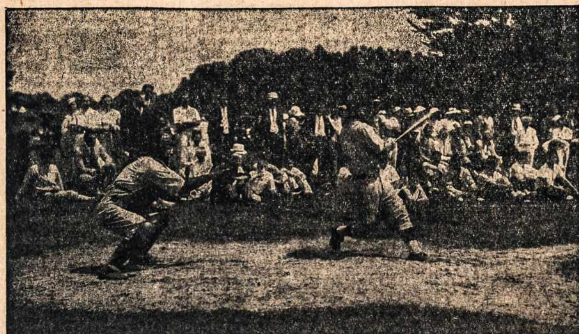
Ir šiais metais Lietuvių Dienoje įvyks šaunus baseball žaidimas.

Iškilmingos Pamaldos, Meno Valandėlė, Šokiai, Sportas.