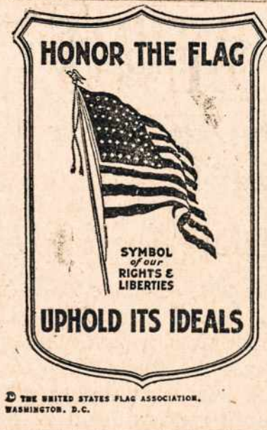
THE UNITED STATES FLAG ASSOCIATION, WASHINGTON, D. C.

"Grand Union" vėliava buvo Revoliucijos vėliava ligi pirmu žvaigždžių ir juostų pagal Kontinentinio Kongreso, birže-