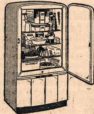
Model AS-6-41 Westinghouse Šaldytuvas $124.95

Jeji jums reikia šaldytuvų, radio, valytuvų, skalbiamų mašinų ir daugelio kitokių dalykų, pirkitė "Darbininkas Electrical Supply" krautuvėje, nes čia pirssite geriausius Westinghouse ir kitų firmų išdirbinius pigiausia kaina.