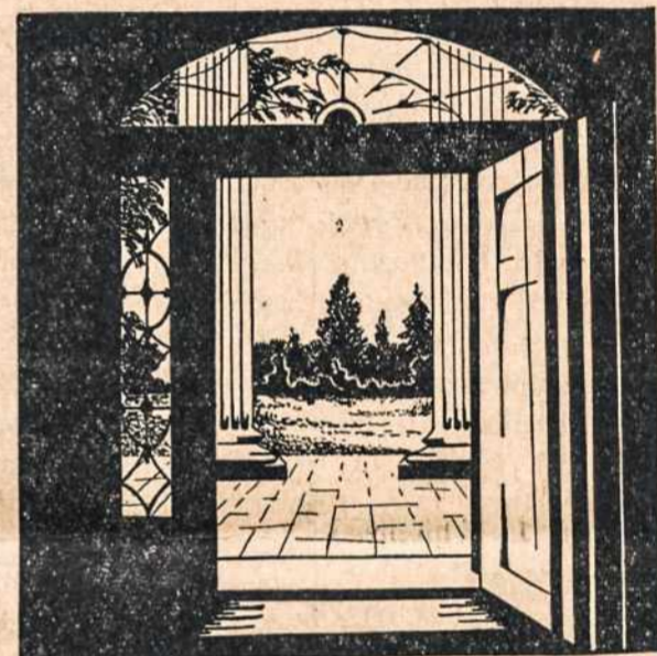
Durys Atviros — Prašom Svetelius..