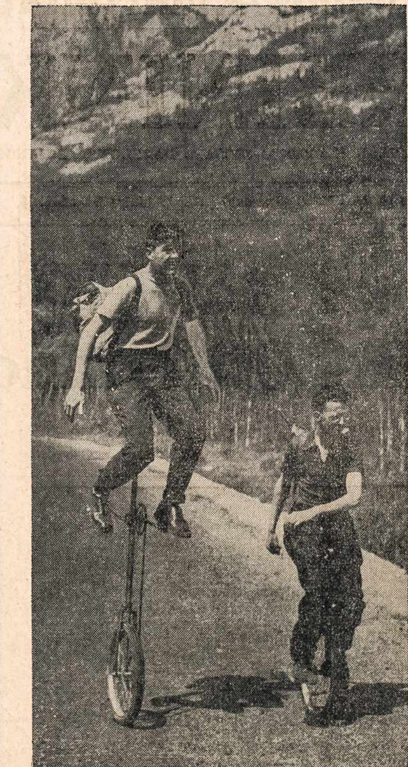
ANT VIENO RATO — Gražus darbas, jeigu jį myli. Du turistai, kurie keliavo per Kanados kalnuotas sritis ir padarė 496 mylias, jie keliavo, kaip vaizde matome ant šios rūšies vienračių. Ar ne triksas!

Prieš Vokietijos - Rusijos karą, komunistai tvirtai laikėsi ir skelbė, kad Europos karas yra tai "imperialistų kova" ir griežtai