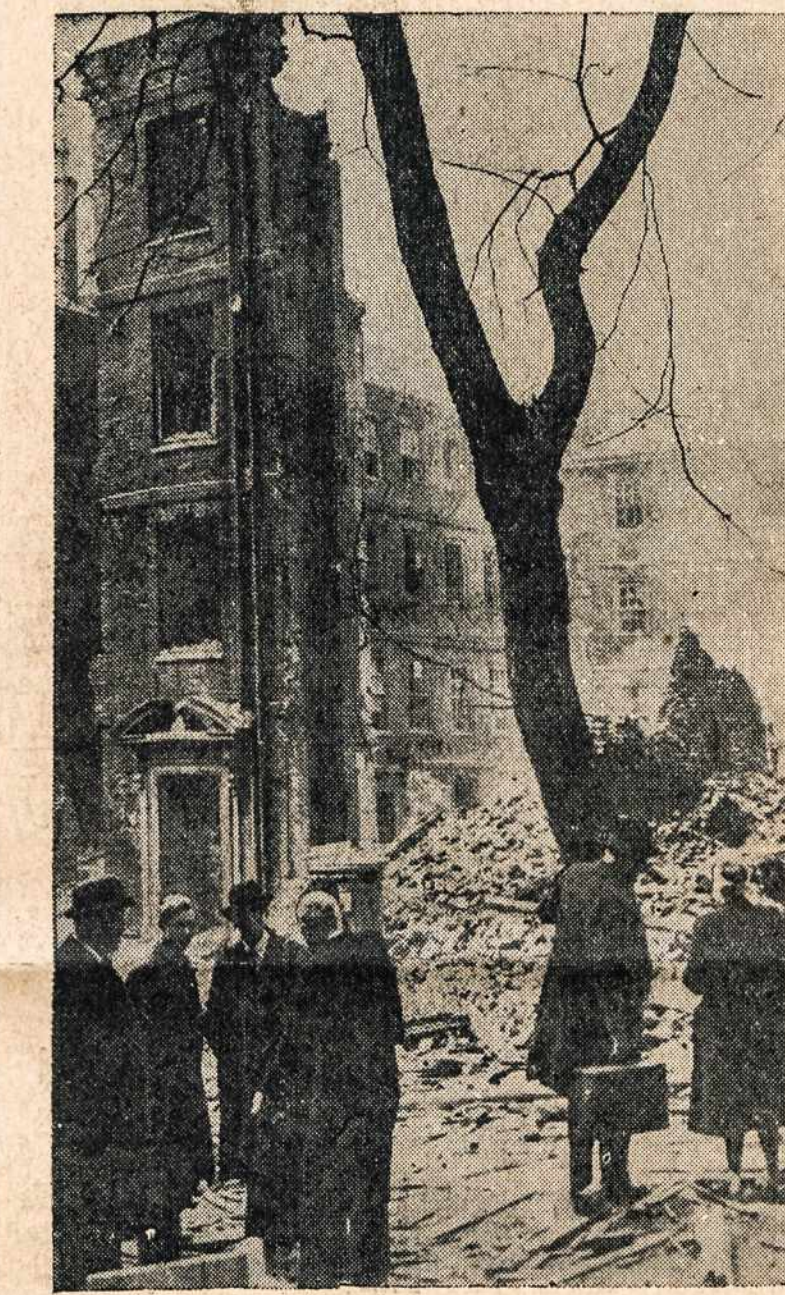
Londono miesto griuvėsiuose patapo ir Inner Temple, Brick Court.

New York, birželio 30 d. — Vakare vakare mirė Ignac Paderewski, įžymus lenkų pianistas, buvęs Lenkijos premieras. Mirė sulaukęs 80 metų amžiaus nuo plaučių uždegimo New Yorko viešbuty.