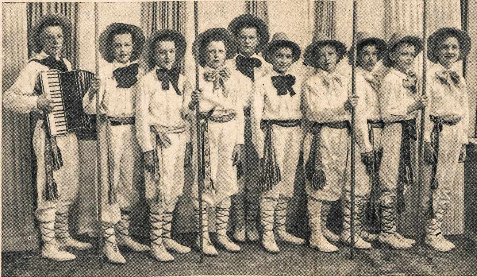
So. Bostono jauni berniukai tautinių šokių šokėjai. Čia jie stovi pasiruošę šokti senovės lietuvių šokį Mikitą Lietuvių Darbininkų Dienoje, Liepos 27, 1941, Brockton Fair Grounds.