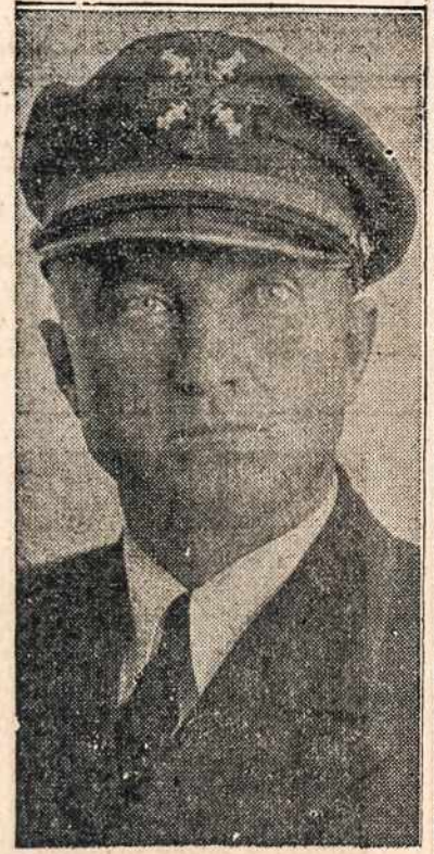
A. a. Steponas Darius

Aplinkui tamsa ir naktis Nors audros jus blaškė, bedugnė viliojo — Atlantas jums nepaslapstis. Palaimos linkėjom, — į augštąjį dangų Maldavom pakėlę rankas, Kad leistų išvysti tą kraštą taip brangų.