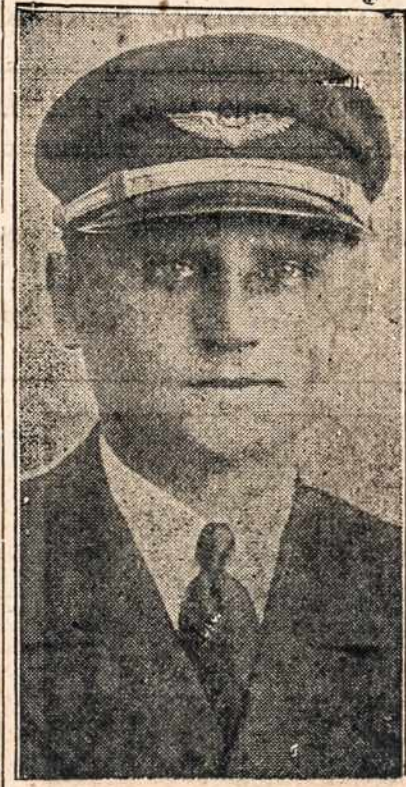
A. a. Stasys Girėnas

ir vargu noriai su jais sveikinasi tie senatoriai ar valdžios atstovai".