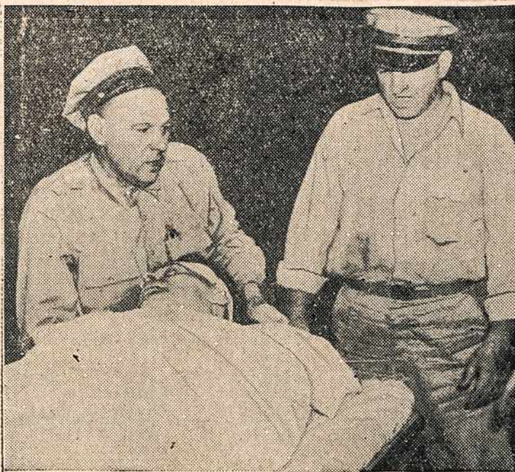
Sužeistas kalėjimo sargas, Holmesburg, Pa., po kalinių išsilaužimo pabėgti. Jis pašovė kalinius kovodamas prieš jų pabėgimą, bet ir pats liko sužeistas.

Labai keista, kad Maskva savo optimistingsiais pranešimais mėgina pasaulį suklaidinti. Gal būt, kad tai reikalinga sovietijos gyventojų dvasiai palaikyti, bet tokia gramozdiškai melaginga propaganda vargu beapdums platesnio pasaulio akis. Meluot tuo numatymu, kad tiesa negreit bus sužinota, gali dar turėt