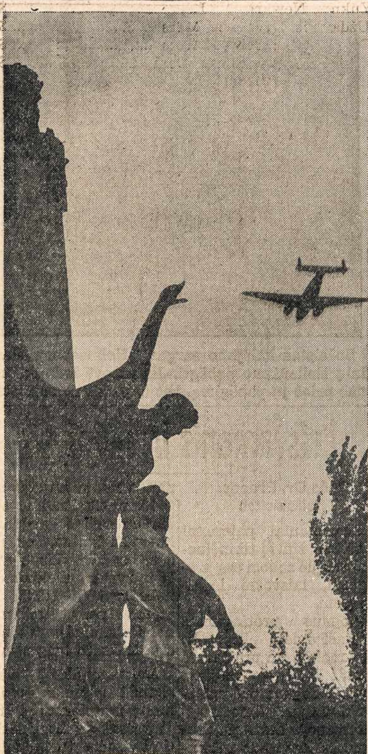
Paveikslas simbolizuoja senovės ir dabartinių laikų karo "botagus". Seniau ir kardas buvo didelis ginklas, kurį šiandien pakeitė bombnešiai su mirties ugnumu ir sunaikinimu.