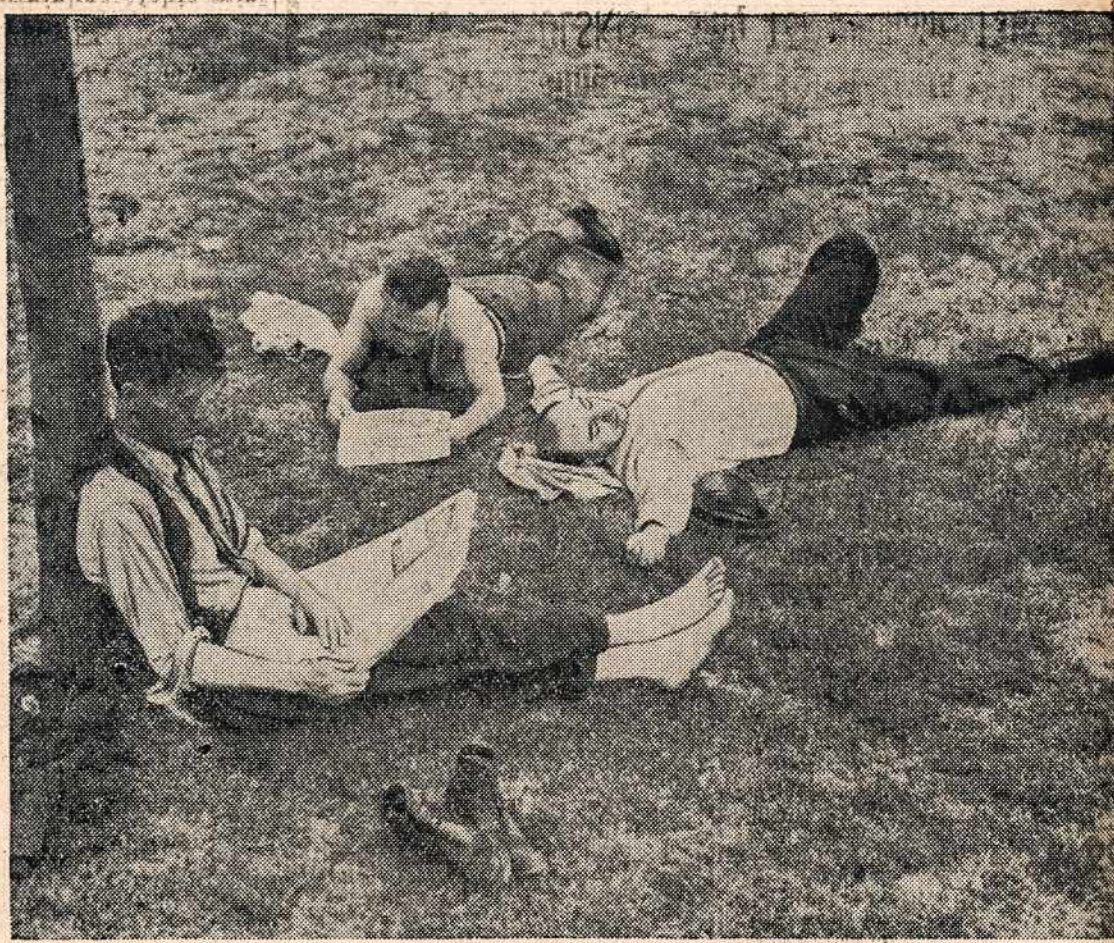
Didelis karštis priverčia ir parkų lankytojus išsitiesti ant žalios žolės patalo, kur nors paūnksnėj, ir net nusimesti batukus nuo kojų. Tai vasaros gėrybės.