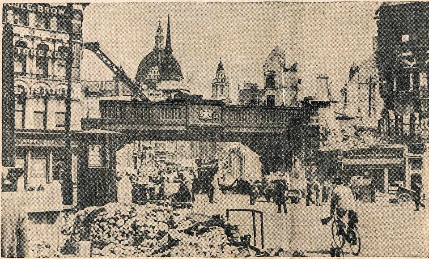
Vaizdas Fleet gatvės Londone, kurioje matomi valymo darbai po nacių naktinių bombardavimų. Panašūs valymo griuvėsių darbai visame Londone vyksta visuomet, kaip tik atlanko miestą nacių Luftwaffe.

Dabartinis pasaulinis karas yra grynai ekonominis. Kariaujančios valstybės kariauja už žemės turtus. Vokietija, Didžioji Britanija, Rusija, Japonija kariauja, kad daugiau pasigrobt žemės turto arba kad jo neprarasti.