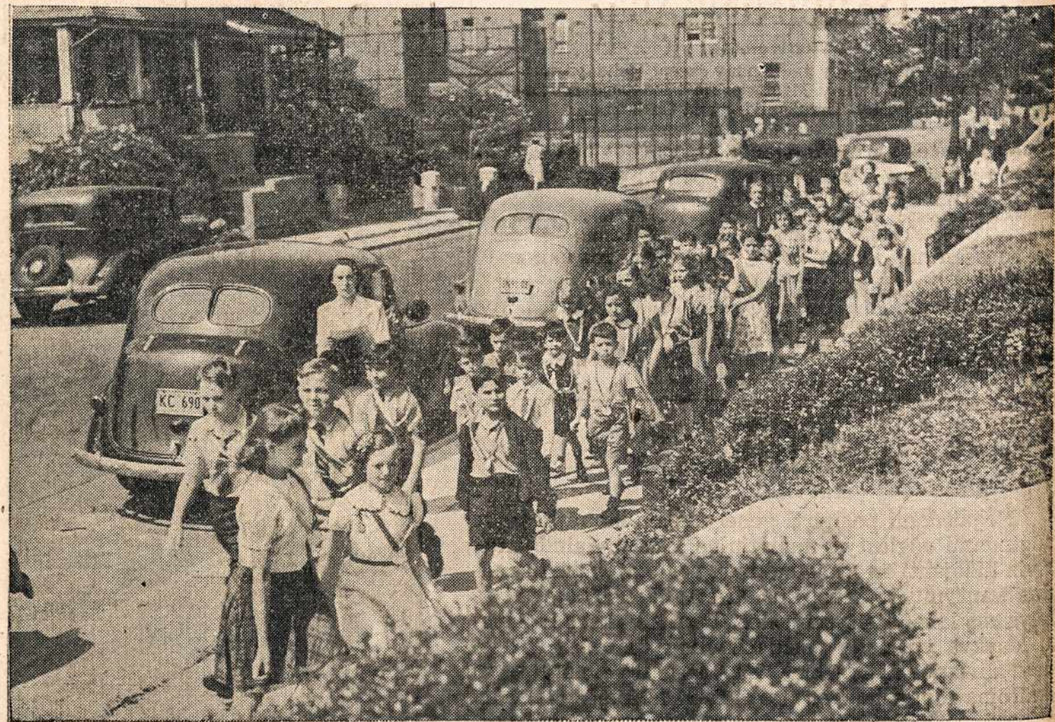
New Yorko viešųjų mokyklų mokiniai, vadovybėje savo mokytojų, kiekvienas su pažymėjimo ženklų, maršuoja į saugias vietas, davus pirmą bandymo pranešimą, kad galis įvykti bombardavimas iš oro. Tai daroma, kad patyrus, kaip būtų galima saugiau ir greičiau pasislėpti nuo priešo lėktuvų.