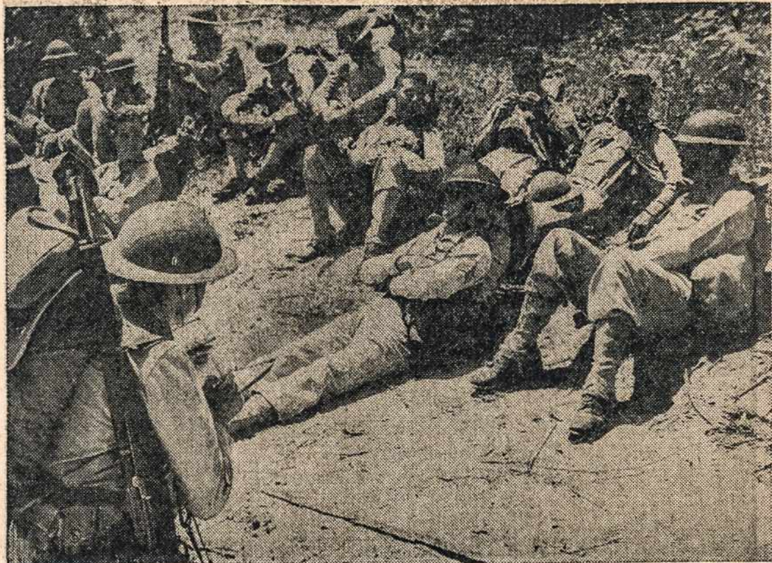
J. V. kariai kelyje iš Fart Benning, Ga. į Tennessee kariškuose pratinuose sustoję valandėlei pailsėti. Čia pasinaudojo fotografai ir štai ir mums parodo, kad ir kariams reikalingas poilsis.