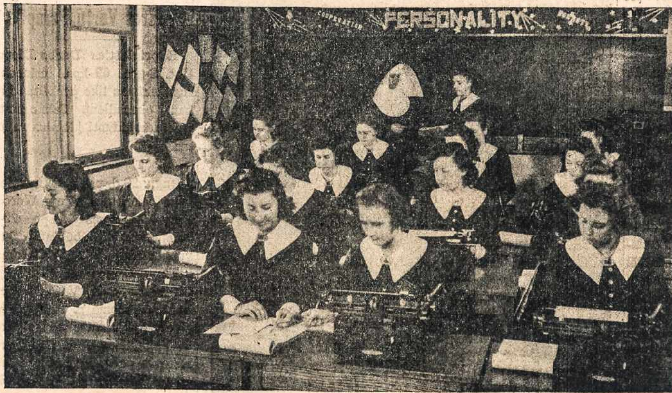
NAUJASIS PASTATAS MODERNISKAS

Atsilankiusieji naujoje mokykloje pastebės gerai apšviestus klasių kambarius, ilgus terrazo koridorių, puikiai įrengtą didelį knygyną, talpinantį arti 8000 knygų, moderniškai ir skoningai įrengta kafeterija, kur mokinės galės sau pasirinkti patinkamus užkandžius, chemijos ir biologijos laboratorijas, įrengimus krutamiems paveiklams, komercijos mokslo patalpas su įvairiomis biznio kursams mašinomis, rūbų siuvimo laboratorija, namų ruošos kurso reikmenis, tinkamą mergaičių sportams aikštę, ir kitas lengvatas aukštosios mokyklos kurams.