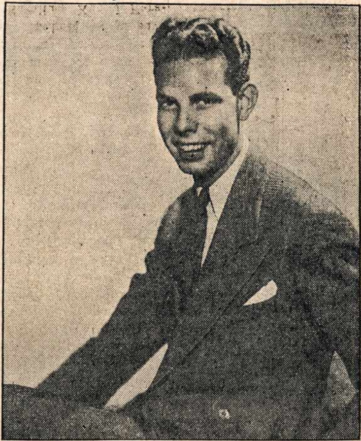
Sparkling dance routines of Hal LeRoy, screen and stage star, will be an added attraction to the spectacular revue "Echoes of Broadway" to be presented each afternoon and evening at Brockton Fair, Sept. 7 to 13 inclusive. LeRoy recently appeared in the motion picture "Too Many Girls" and in the Broadway Musical of the same name. He was featured in Al Jolson's picture "Wonder Bar" and with Jimmie Durante in "Start Cheering."

antkapių vienų ir antrų vaikštinėja įvairių luomų žmonės, o medžių šakose meilūs paukšteliai savo nerūpestingą giesmę čyrena. Čia palaidota visa eilė žymių Ispanų. Parašai antkapiuose primena krašto apgyvendinimo laikotarpį. Ten stypos kryžiai, atkeliavusių aukso atradimo laikais. Prie bažnyčiose sienos ilsisi, sunkius darbus atlikę, misijonieriai. Kapinės gera vieta mąstyti. Žemiškoji kelionė šiems jau baigta. Baigtos ašaros, šypsenos dingusios. Baigti vargai, žiaurūs skausmai ir neprotingi lėbavimai. Geri darbai amžinybėje vertės teturės. Kaž kur skaitytos eilės mintin atėjo —