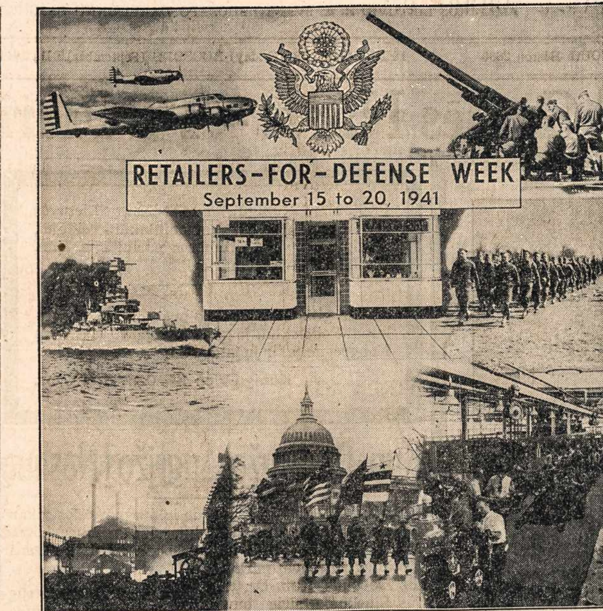
Jung. Valstybių Tautinio Saugumo Bonų ir Stampų Retail krautuvėse pardavimo savaitę garsina nuo rugs. 15 ligi rugs. 20. Šalies patriotingoji visuo- menė kviečiama pirkti savisaugos Bonus ir Stampes.

"Gražų birželio 22 d. sek- madienio rytą sutrikdė smarkūs sproginiai ir lėk- tuvų užesys. Kaliniai, pa-