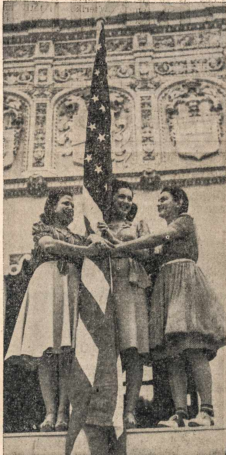
Trys kadetės iš Puerto Rico Universiteto suėjusios parengtos iškilmėse Rio Pedroj, paminėti 43 metų sukaktį nuo Puerto Rico prijungimo prie Jung. Valstybių, jos žvaigždžių ir juostų vėliavos šešelyje apkabino vėliavą savo švelniomis rankutėmis.