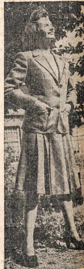
Klasiškas apsirengimas. Patogus kelionėj.