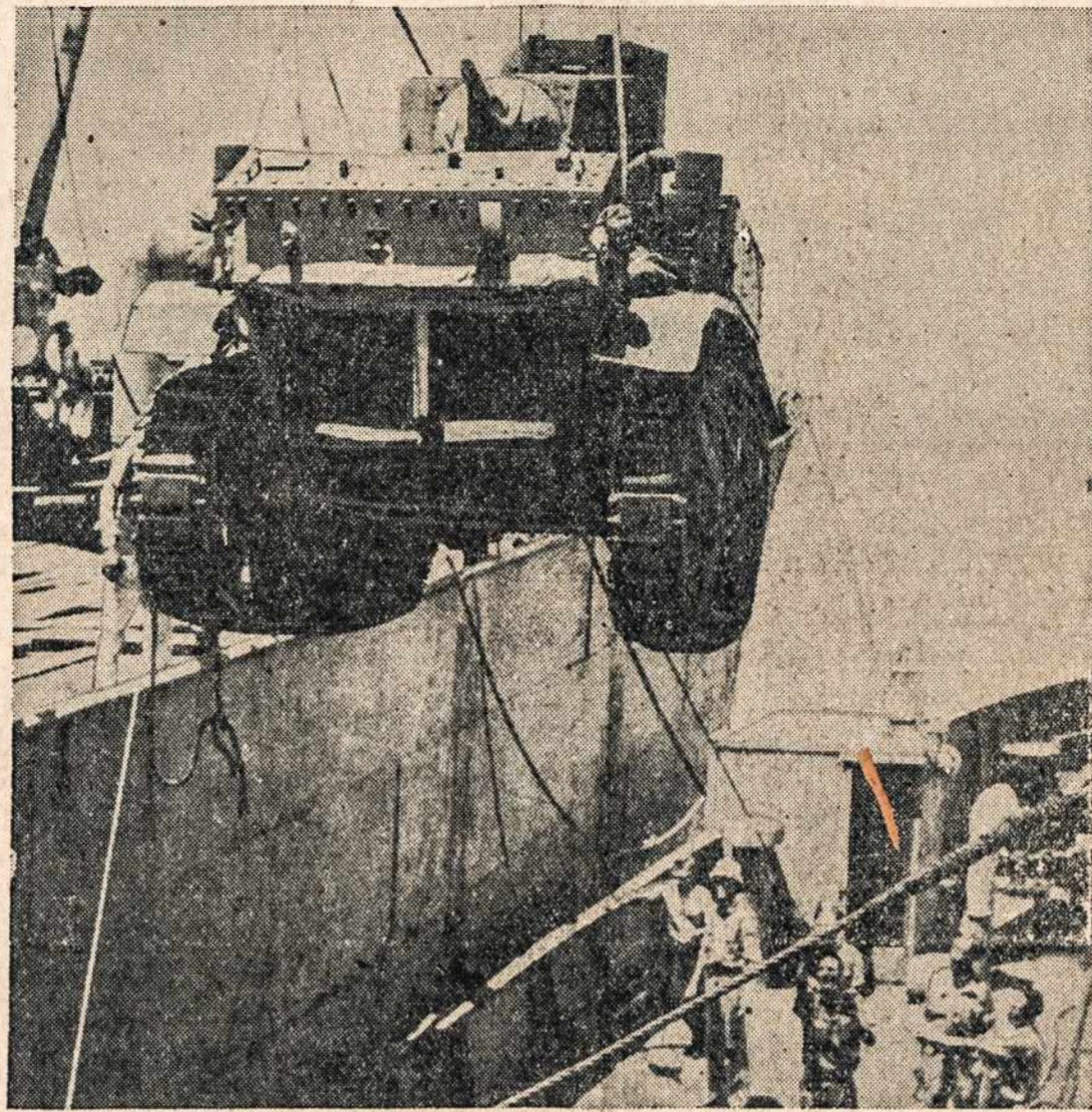
Jung. Valstybių tankai loduojami į laivus ir siunčiami į vidurinius rytus, kur juos perima britų karo jėgos ir rengia pirtį "ašies" partneriams.

Amžiną atilsį duok mirusiems, Viešpatie, ir amžinoji šviesa lai jiems šviečia.