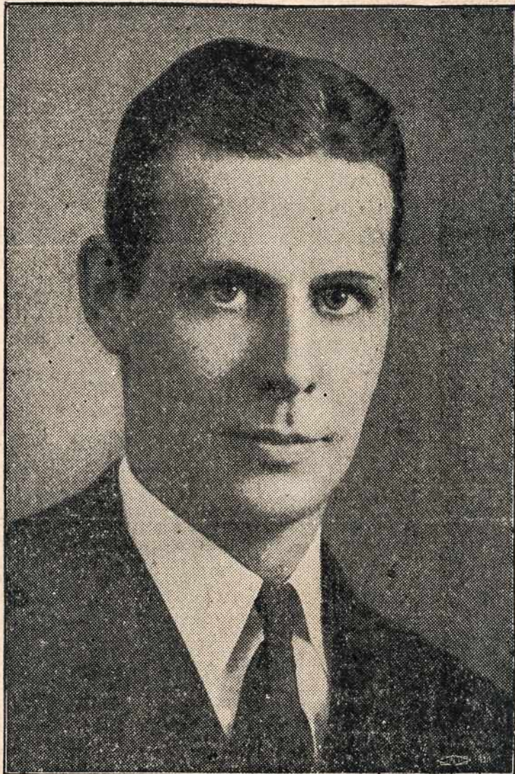
Maurice J. Tobin