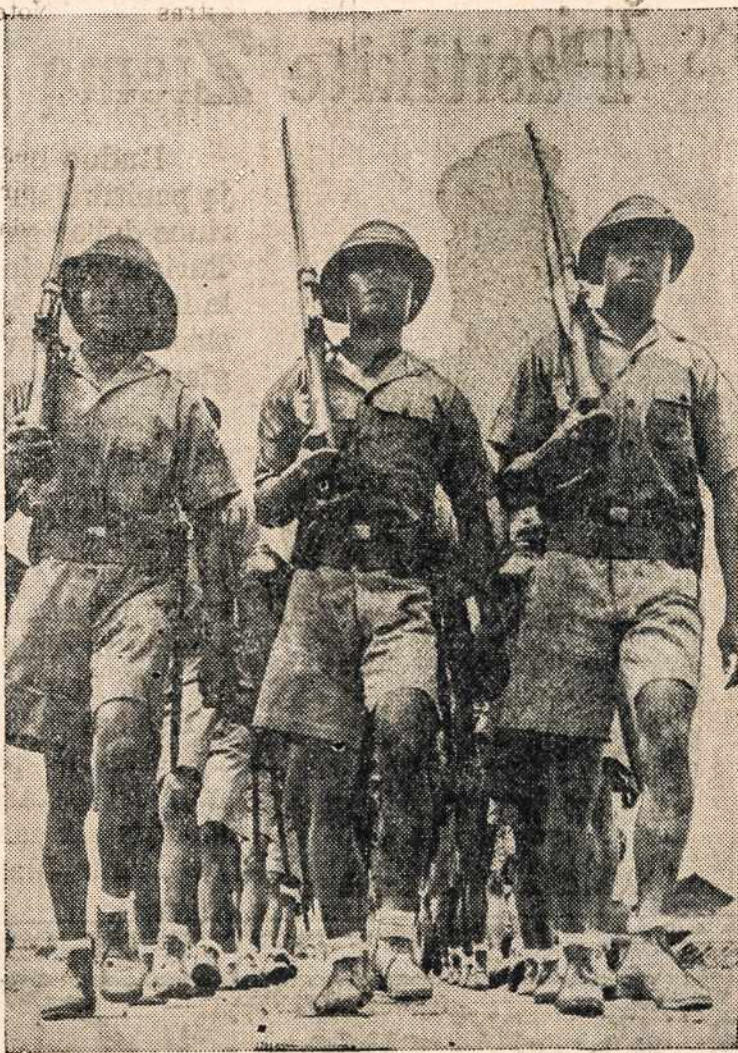
Philipiniečių kariai su pilnu entuziazmu grįžta į savo stovyklą po dienos manevrų, kuriems vadovauja Jung. Valstybių Armijos viršininkai.

Nusizeminimas Evangelijos dvasioje ir maldavimas Dievo malonės bei pagalbos pilnai suderinami su savęs gerbimu, pasitikėjimu savimi ir dvasišku ryžtingumu. Kristaus Bažnyčia, kuri visais ir pat naujaisiais laikais daugiau turi išpažinėjų, bei laisvorių savo kraują už ją liejusiu liudininkų, kaip kuri kita religinė bendruomenė, yra nereikalinga gauti iš tos pusės pamokymų apie didvyrišką ryžtingumą bei veikimą. Savo paviršutiškais plepalais apie krikščio-