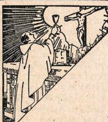
Tuos, kuriuos gvendami mylėjo- me, nepamirškime jų ir jiems mirus. — šv. Ambr.

Kadangi pereitą savaitę dėl Padėkos dienos išėjo tik vienas "Darbininko" numeris, todėl