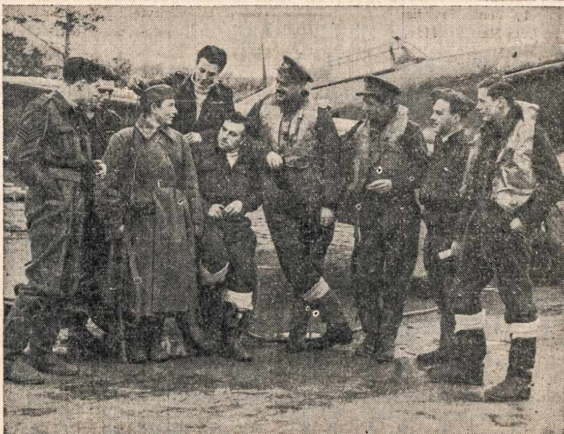
Paveikslas porodo britų lakūnus, kurie atskrido Sovietų Rusijoj imti dalyvumo kare prieš nacių. Viduj su šautuvu stovi raudonarmiečių sar- gybinis, tūlame rusų aerodrome.

Lapkričio 15 d., Columbus svetainėje įvyko Cambridge M-ry S-gos 22 kps., jubiliejinė vakarienė su šokiais. Sąjungie- čių parengimas labai gražiai pavyko, nes dalyvavo gražus būrys svečių. Atsilankiusieji li- ko patenkinti Sąjungiečių vai- singumu. Sąjungiečių parengi- mui vadovavo p-nia A. Ambro- zaitienė; vyr. šeimininkės pa-