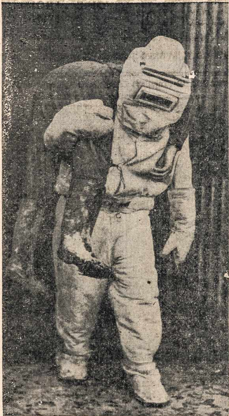
Tai ne nuo "Marso" žmonės, tai tik asbestiniais rūbais apsilvę Anglijos pilietis daro pratybas, kaip išnešti auką iš ugnies pavojaus, pats būdamas visiškai saugus.

Dabar vartojami Reicho pašto ženklai. Pradėjo veikti pašto susisiekimai tarp Reicho ir Ostlando. Iš Reichą ir okupuotąsias sritis.