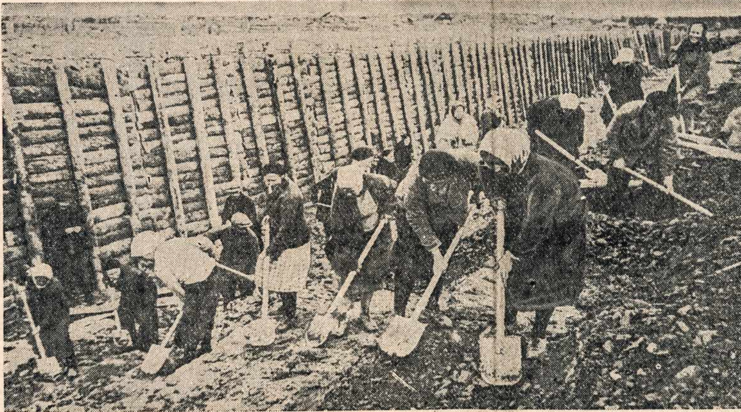
Kada naciai paartėjo prie Leningrado, tai tuomet sovietų vadai sušuko: "apginkime miestą nuo priešio". Kadangi sovietijoj viskas yra nusavinta ir darbo programa priklauso išimtinai nuo komisarų valdžios, taigi ir šiuo komisarų atsišaukimu darbininkų jėgos buvo nukreiptos į apkasų ir įsitvirtinimo darbus, kaip liūdią šis paveikslas.