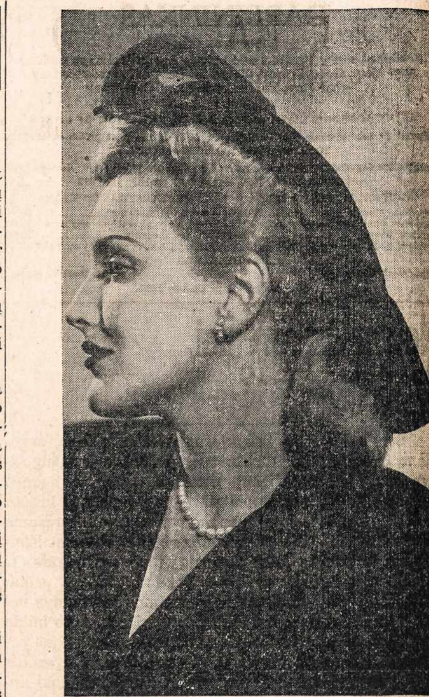
Pompadūriškas Baretas, kuris gražiai išvystytas priešakį jos kepurės su juoda plunksna priduoja skoningo merginai pasipuošimo.

Šie daviniai paimti iš gyvulių pasaulio todėl, kad su mažais gyvūnais patogiau mokslininkams atlikti įvairius bandymus. Bet tie mokslo patyrimai daug pasako ir dėl žmogaus. Vitamins D turi didelės įtakos į augimą; didelėmis dozomis, duodamas preparato formoje gyvūnams daugiau mažiau yra nuodingas. Organuose atsiranda sukalkėjimai. Moksle senai kalbama apie D — provitaminą ir D — vitaminą. Provitaminas laikomas tos medžiagos, kuriose, paveikus saulės