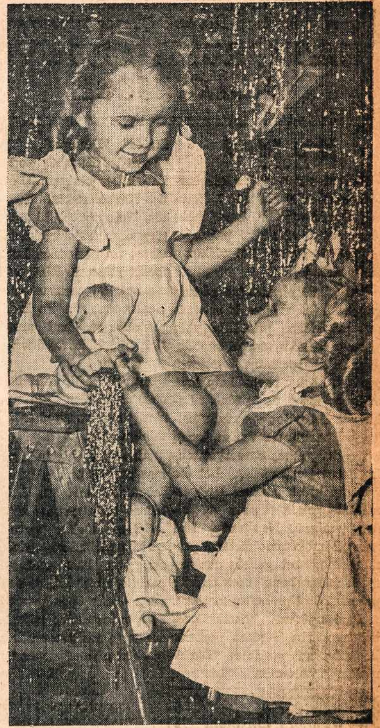
Dvi Britų karo pabėgėlės mergaitės New Yorke, pakviestos British War Relief "dovanų krautuvėje" papuošti pirmą Kalėdų eglutę.

Bet tiesa, demokratija šį karą laimės. Popiežiaus taikingi pasiūlymai anksčiau ar vėliau bus įrašyti į pasaulio tautų TAIKOS sutartį. Krikščioniško pasaulio valdovas, Kristaus Bažnyčios įpėdinis suvaidins svarbią rolę netolimoj ateity; Jo pareikšti žodžiai Kalėdų švenčių proga pasaulio žmonėms nebus veltui. Svarbu ir mums, lietuviams, kad Jo Šventenybė, Popiežius Pius XII, aiškiai, nesvyruojančiai pasisakė mažųjų tautų teisių klausime.