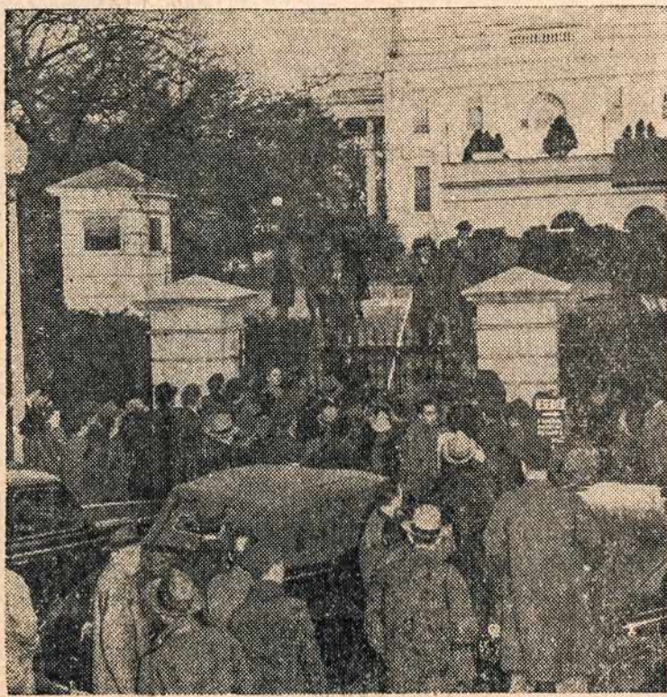
Būriai piliečių Vašingtone susirinkę prie Baltųjų Rūmų norėdami patirti vėliausių karo žinių iš karo fronto.

Washington, gruodžio 29 — Amerikos karo vyriausybė praneša, kad Japonų lakūnai bombardavo A- merikos karo laivus ir du jų sužalojo.